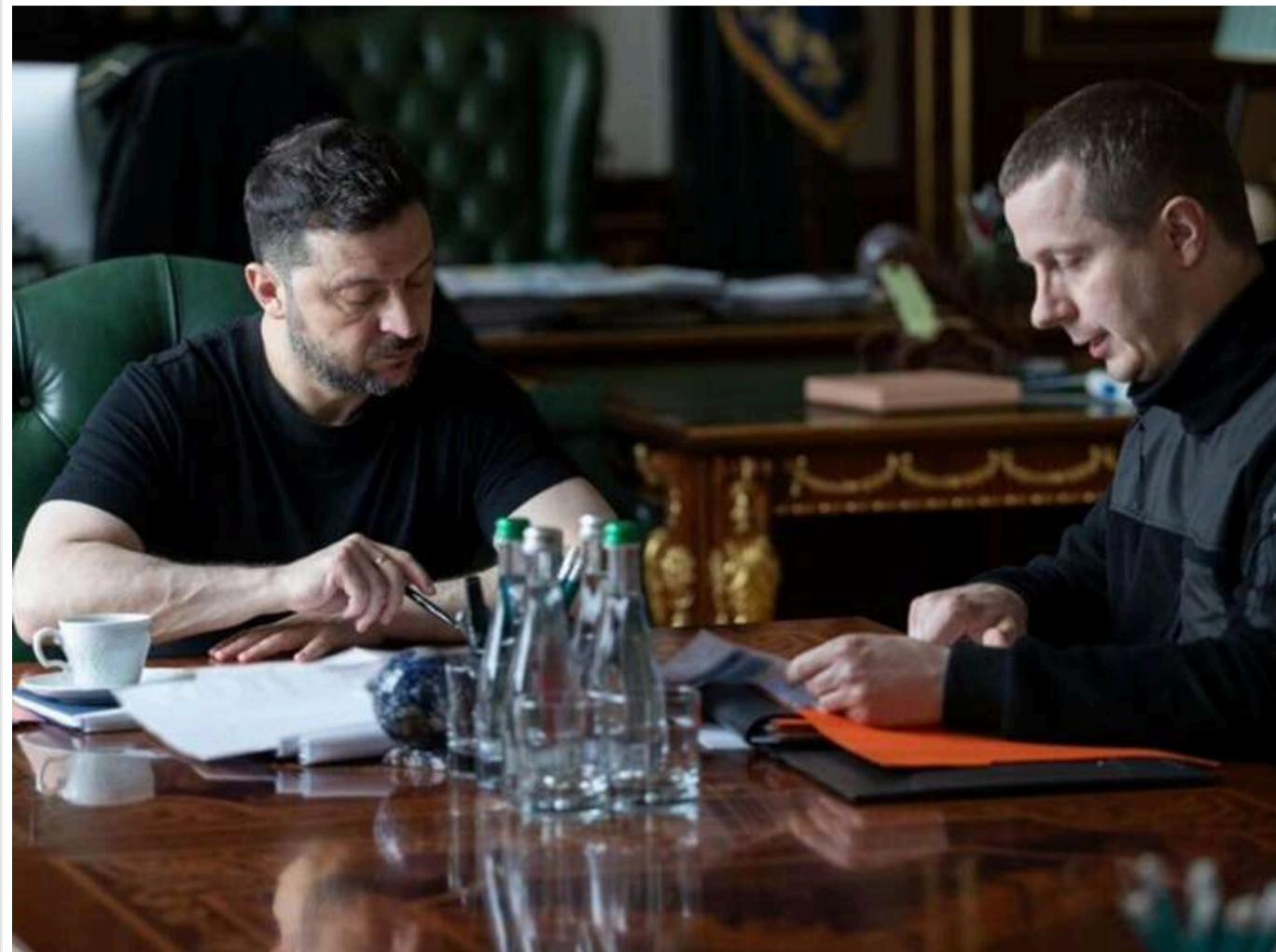
На основі даних розвідки: Зеленський заявив про поглиблення кризи в Криму та зростання тривожності в РФ

Українська розвідка отримала свіжі дані, які вказують на поглиблення паливної, логістичної та управлінської кризи на тимчасово окупованому Кримському півострові. Проблеми окупаційної адміністрації стали результатом систематичних ударів по російській військовій логістиці та нафтопереробній галузі.