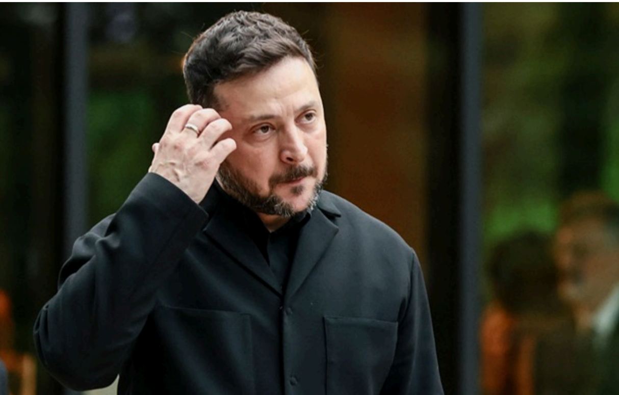
Зеленський затвердив план СБУ

Російське суспільство починає усвідомлювати ціну агресії, стикаючись із порожніми резервуарами на заправках, стрімким зубожінням та невідворотністю розплати за розв'язану війну.