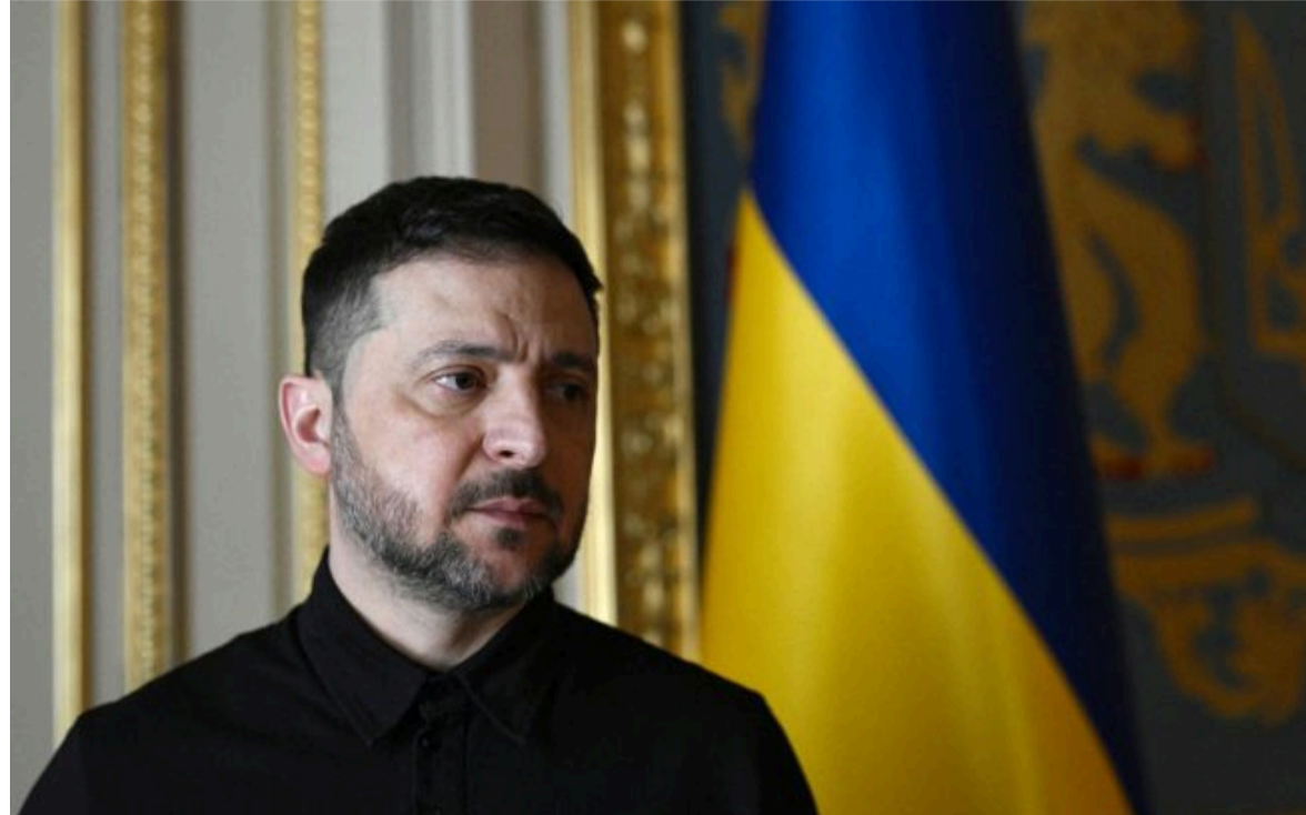
Фото: Володимир Зеленський, президент України