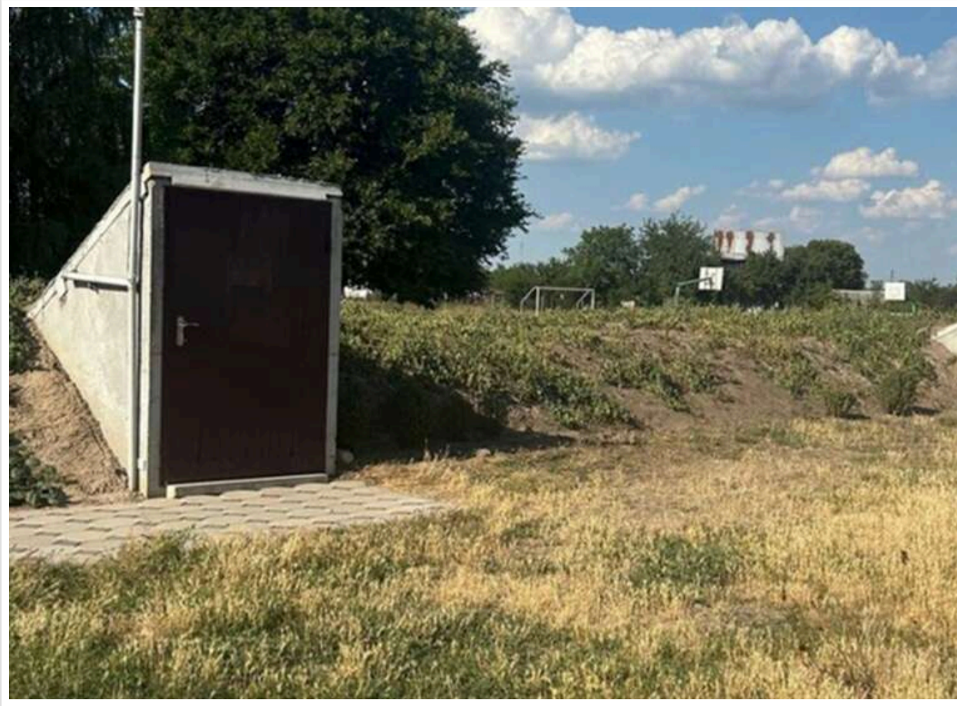
Схема на 81 мільйон: на закупівлі укриттів для шкіл і військових викрили масштабні розкрадання

У процесі придбання захисних споруд для навчальних закладів і військових об'єктів на Дніпропетровщині та Чернігівщині злочинна група заволоділа 47 мільйонами гривень. Усі ці факти викрили в межах одного кримінального провадження.