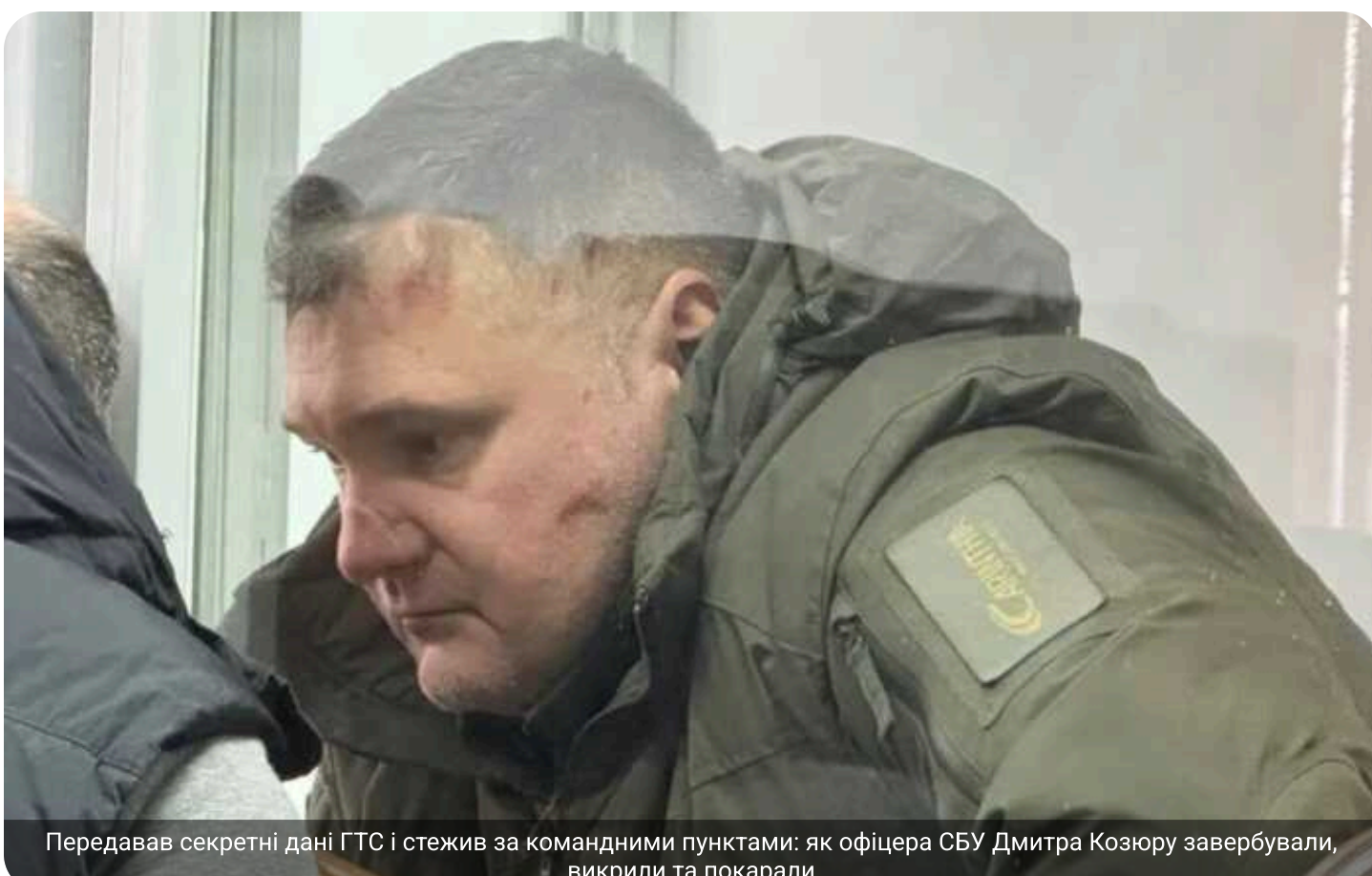
Передавав секретні дані ГТС і стежив за командними пунктами: як офіцера СБУ Дмитра Козюру завербували, викрили та покарали

Суд виніс вирок колишньому керівнику Штабу Антитерористичного центру Служби безпеки України Дмитру Козюрі, котрий із 2018 року працював на ФСБ РФ. Зрадник отримав найсуворіше покарання – довічне позбавлення волі.