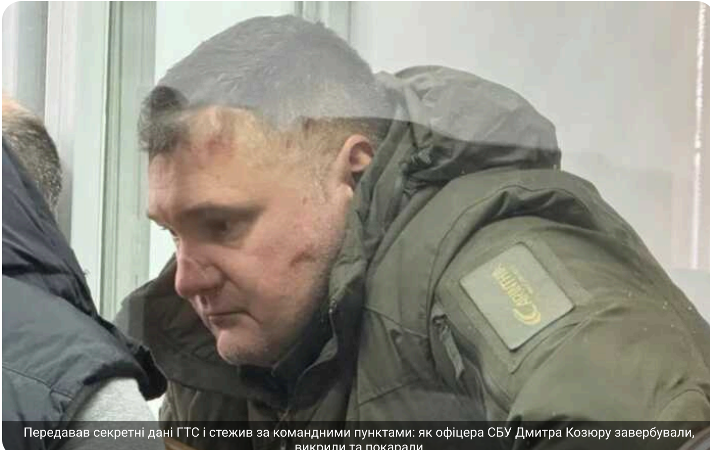
Передавав секретні дані ГТС і стежив за командними пунктами: як офіцера СБУ Дмитра Козюру завербували, викрили та покарали

Суд виніс вирок колишньому керівнику Штабу Антитерористичного центру Служби безпеки України Дмитру Козюрі, котрий із 2018 року працював на ФСБ РФ. Зрадник отримав найсуворіше покарання – довічне позбавлення волі.