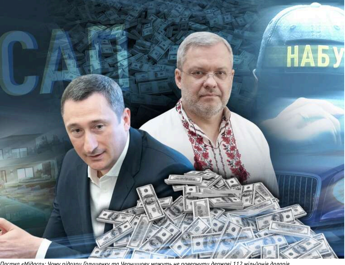
Пастка «Мідаса»: Чому підозри Галушенку та Чернишову можуть не повернути державі 112 мільйонів доларів

Читати на руському Read in English Додати на бачок збережено в Google