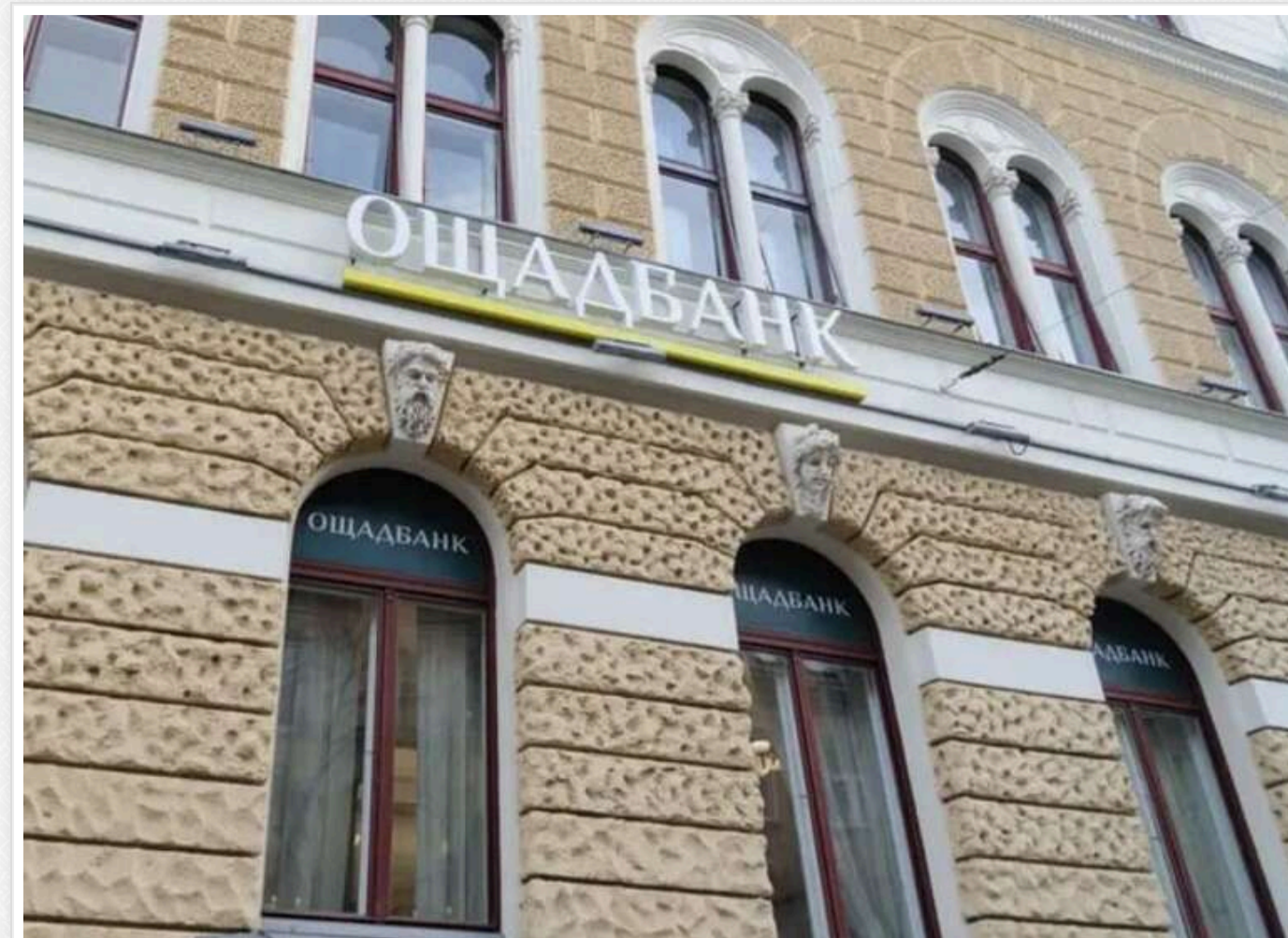
Семеро українських інкасаторів "Ощадбанку" повернулися додому після затримання в Угорщині

Семеро інкасаторів "Ощадбанку", затриманих в Угорщині, повернулися в Україну.