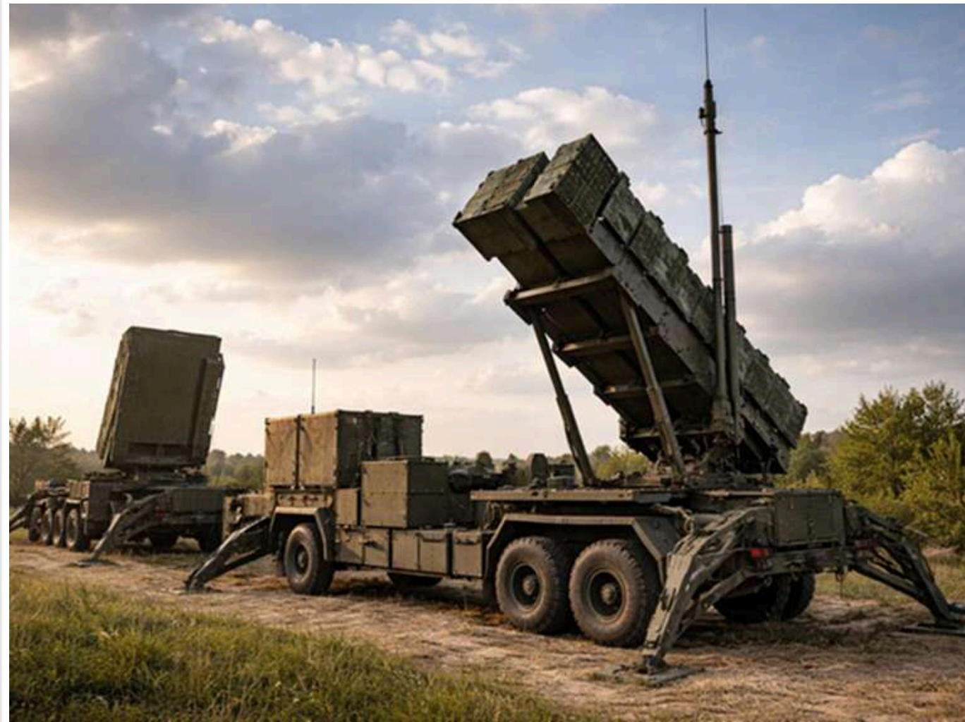
Україна отримала 600 ракет Patriot за роки війни, в той час як конфлікт з Іраном поглинає сотні ракет на добу

Читати на руском Read in English Додати як бажане джерело в Google