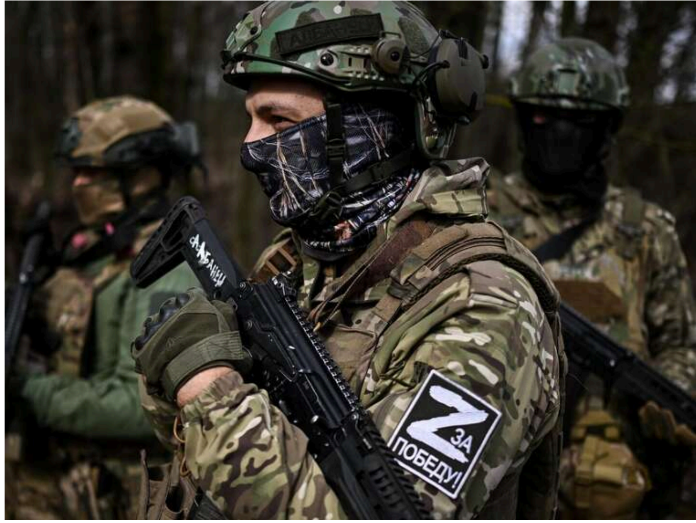
«Жодного наступу на Суми немає»: у ЦПД розкрили реальну ситуацію на прикордонні Сумщини

Читати на русском Read in English Додати як бажане джерело в Google