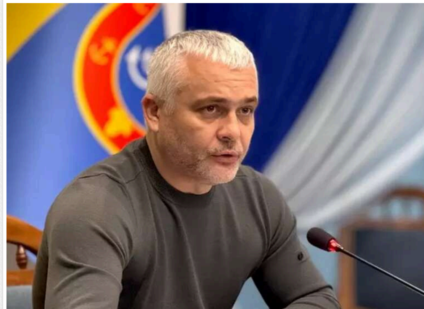
«Зернова десятисина» та монополія на добрива: як рішення голови Одеської ОВА Олега Кіпера впливають на ринок та ціни

Читати на руском Read in English Додати як бажане джерело в Google