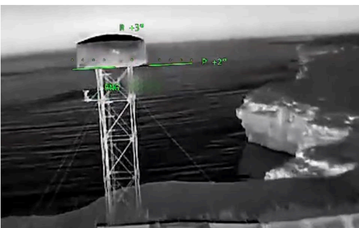
Ураження цілей в Криму

Серед уражених цілей - Таврійська теплоелектростанція у Сімферополі, нафтобаза у Джанкої, газові компресорні станції.