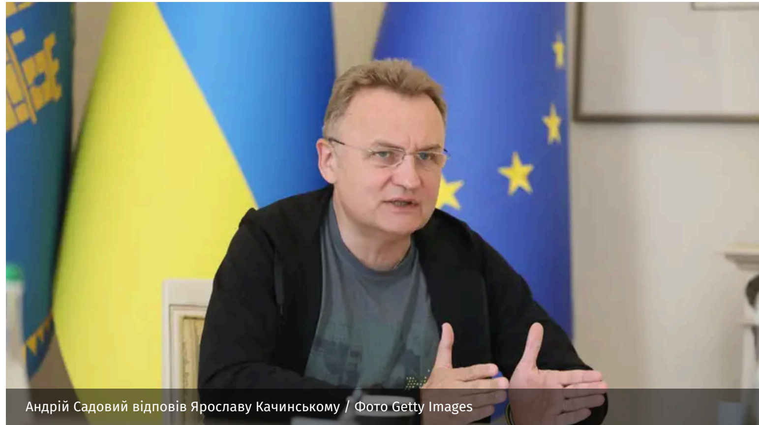
Андрій Садовий відповів Ярославу Качинському

У польському місті Гданськ відбувається Конференція з відновлення України 2026. Під час неї лідер партії "Право й справедливість" розкритикував українського політика.