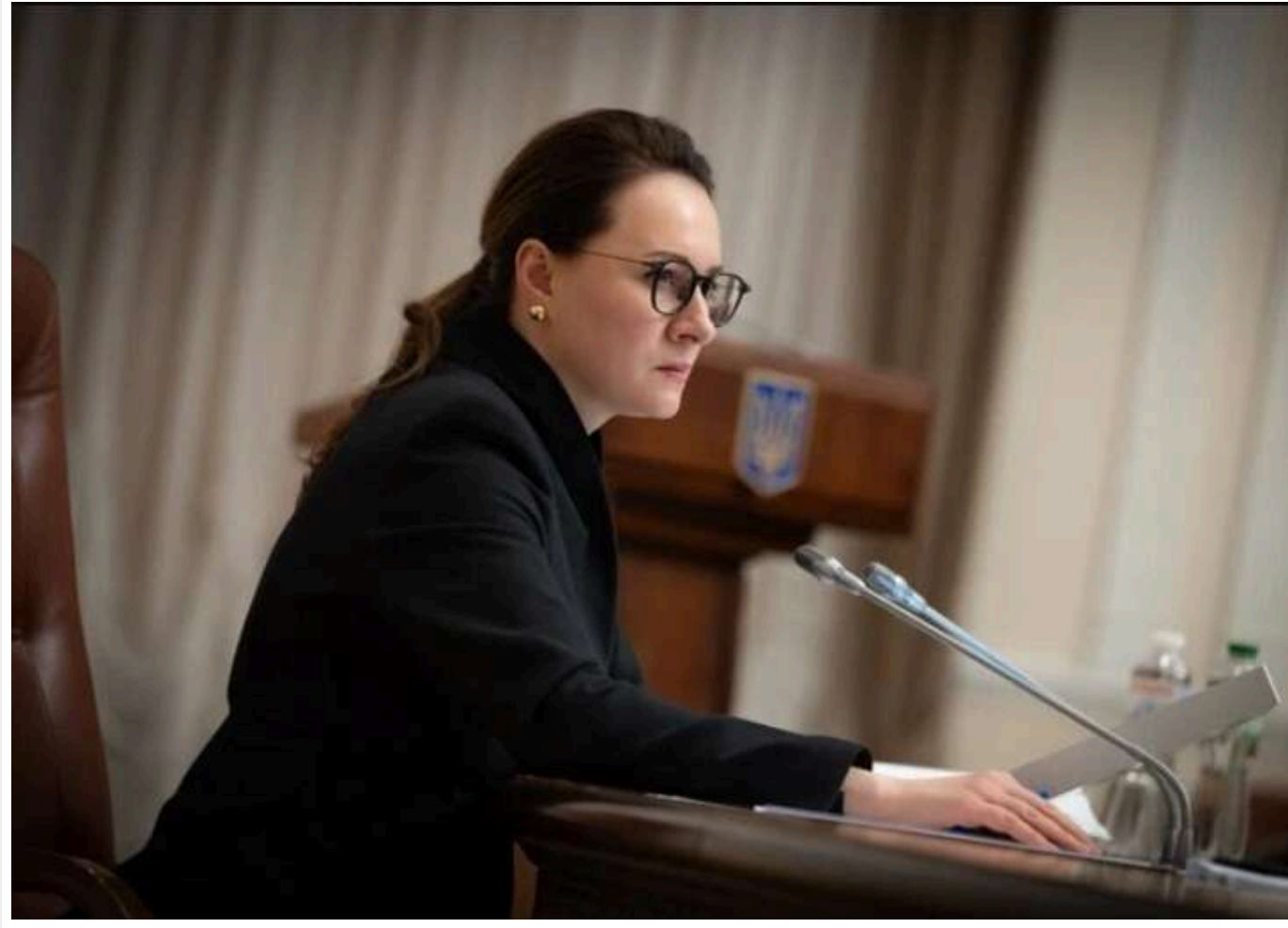
Свириденко: «Укрнафта» стане орієнтиром справедливої ціни на ринку пального

Читати на руськом Read in English Додати як бажане джерело в Google