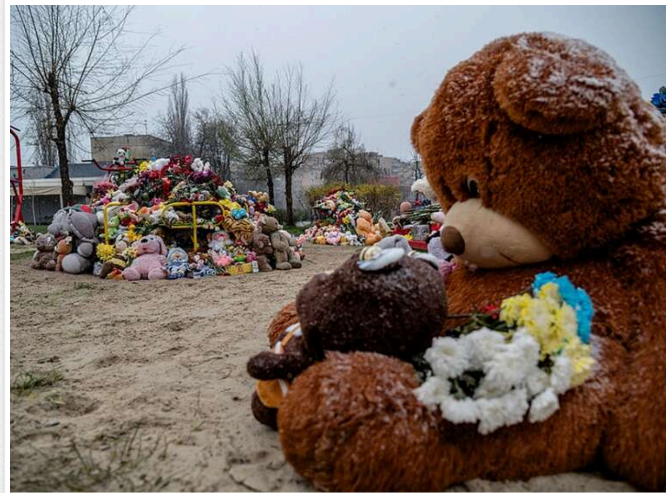
Лубінець: Від початку повномасштабної війни в Україні загинуло 688 дітей, ще майже 2400 – поранені

Читати на руском Read in English Додати як бажане джерело в Google