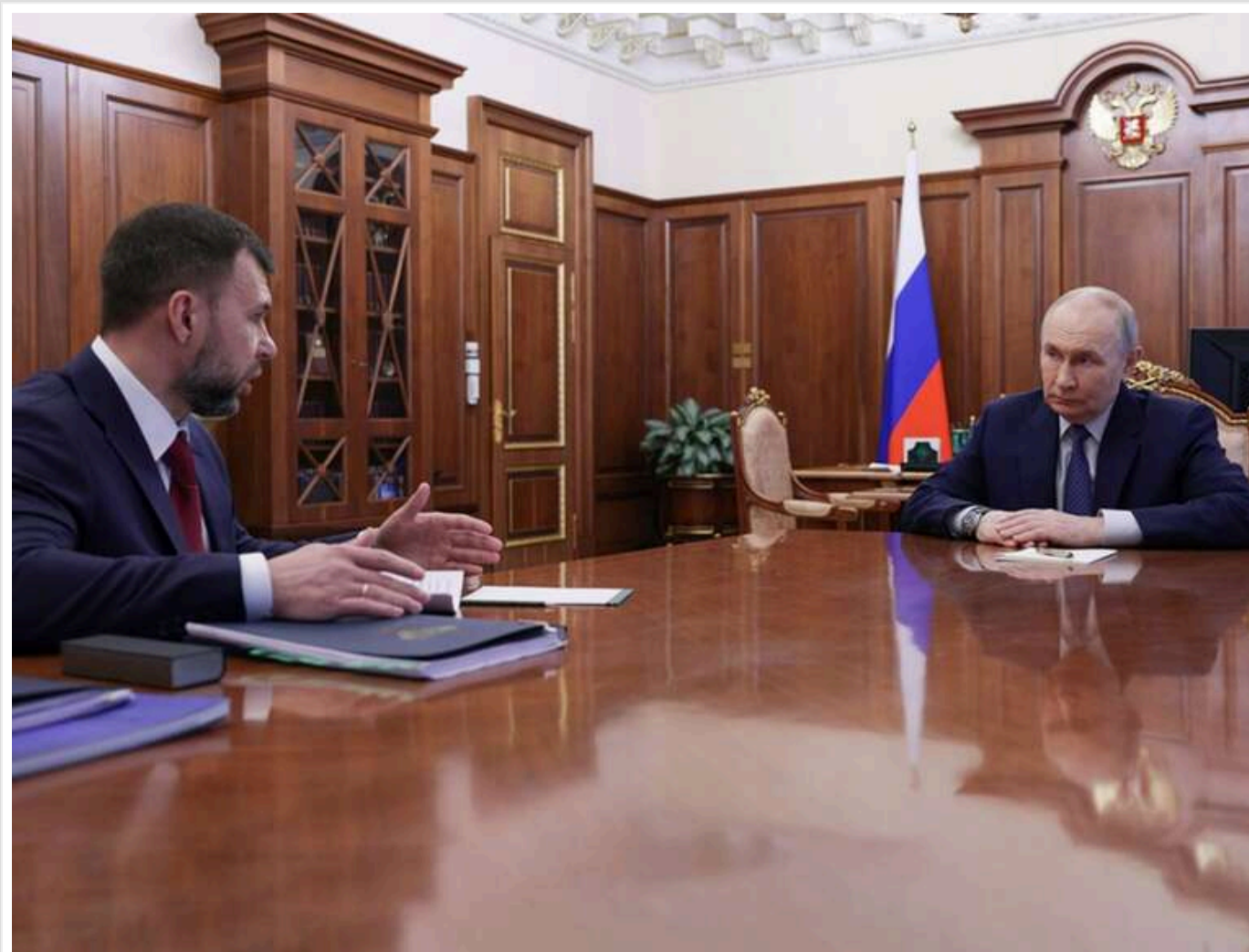
«Земля для колонізації»: ватажок "ДНР" Пушилін запропонував Путіну масово селити російських солдатів на окупованій Донеччині

Читати на руськом Додати як бажане джерело в Google