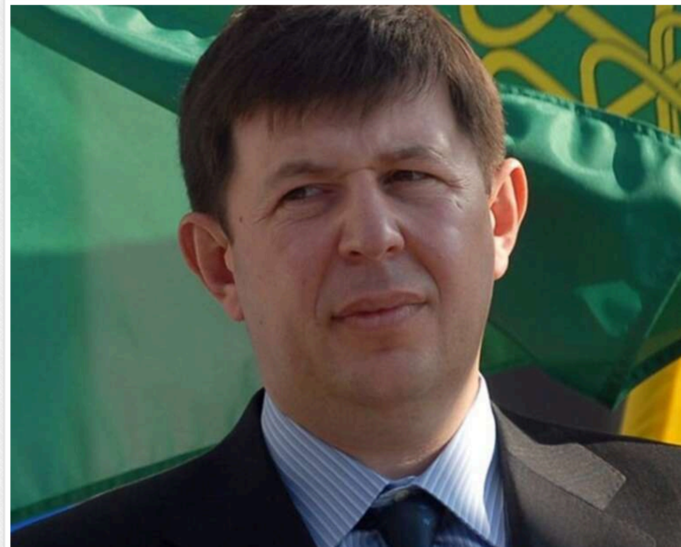
Судовий реванш Козака: як екснардеп через Луганський адмінсуд "обнулив" найважчі висновки НАЗК

Читати на руськом Read in English Додати як бажане джерело в Google