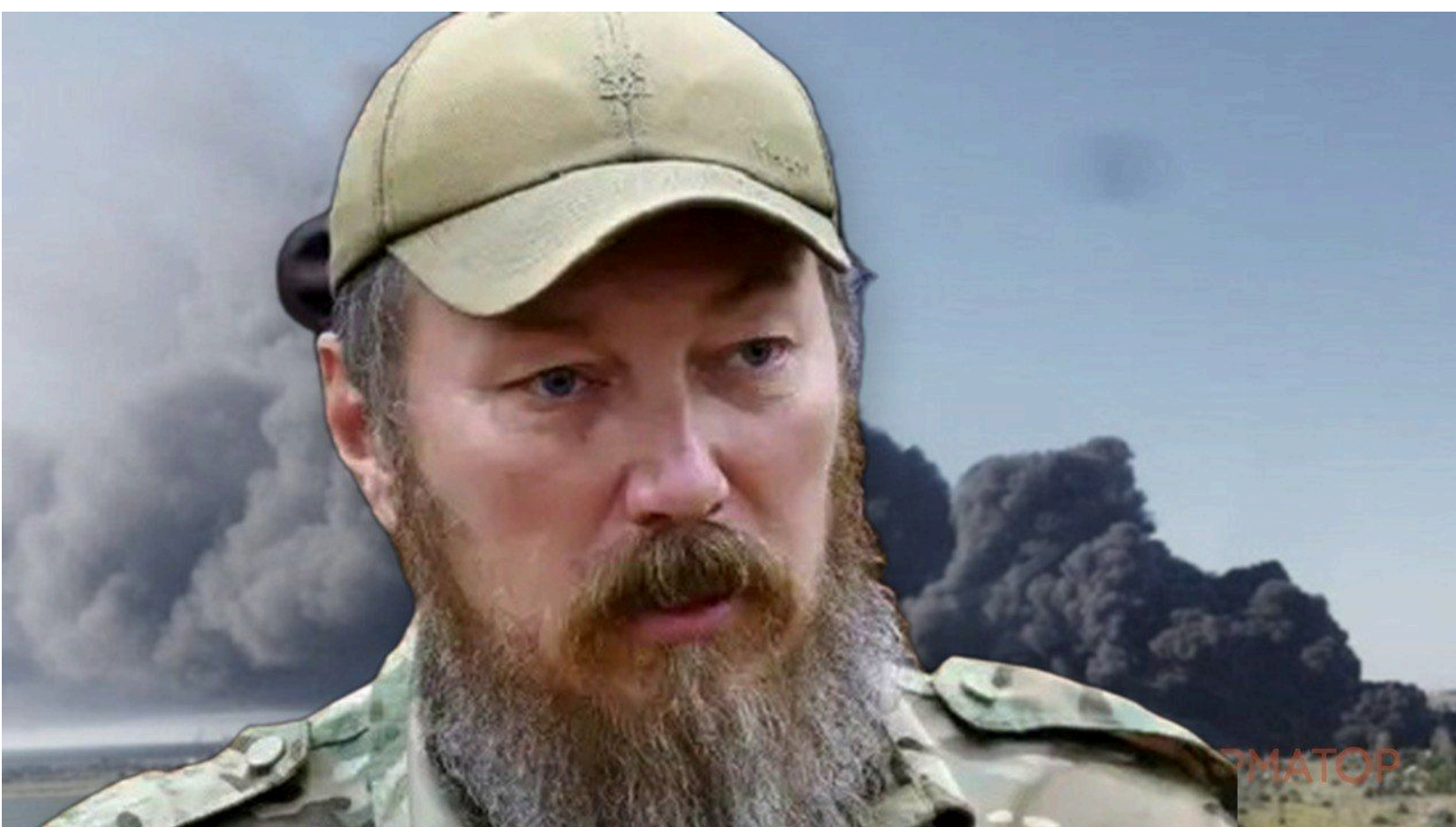
Мадяр розкрив цілі ударів по Криму 25 червня

Сили безпілотних систем ЗСУ вночі 25 червня завдали масованого удару по окупованому Криму - відпрацьовано 38 цілей, серед яких три берегові радіолокаційні станції, Таврійська теплоелектростанція, нафтобаза та дві електропідстанції. Двома ночами раніше "Птахи" СБС уразили Таврійську ТЕС, газорозподільну станцію та нафтобазу у Криму - тоді супутниковий моніторинг NASA FIRMS зафіксував одночасні пожежі на трьох об'єктах.