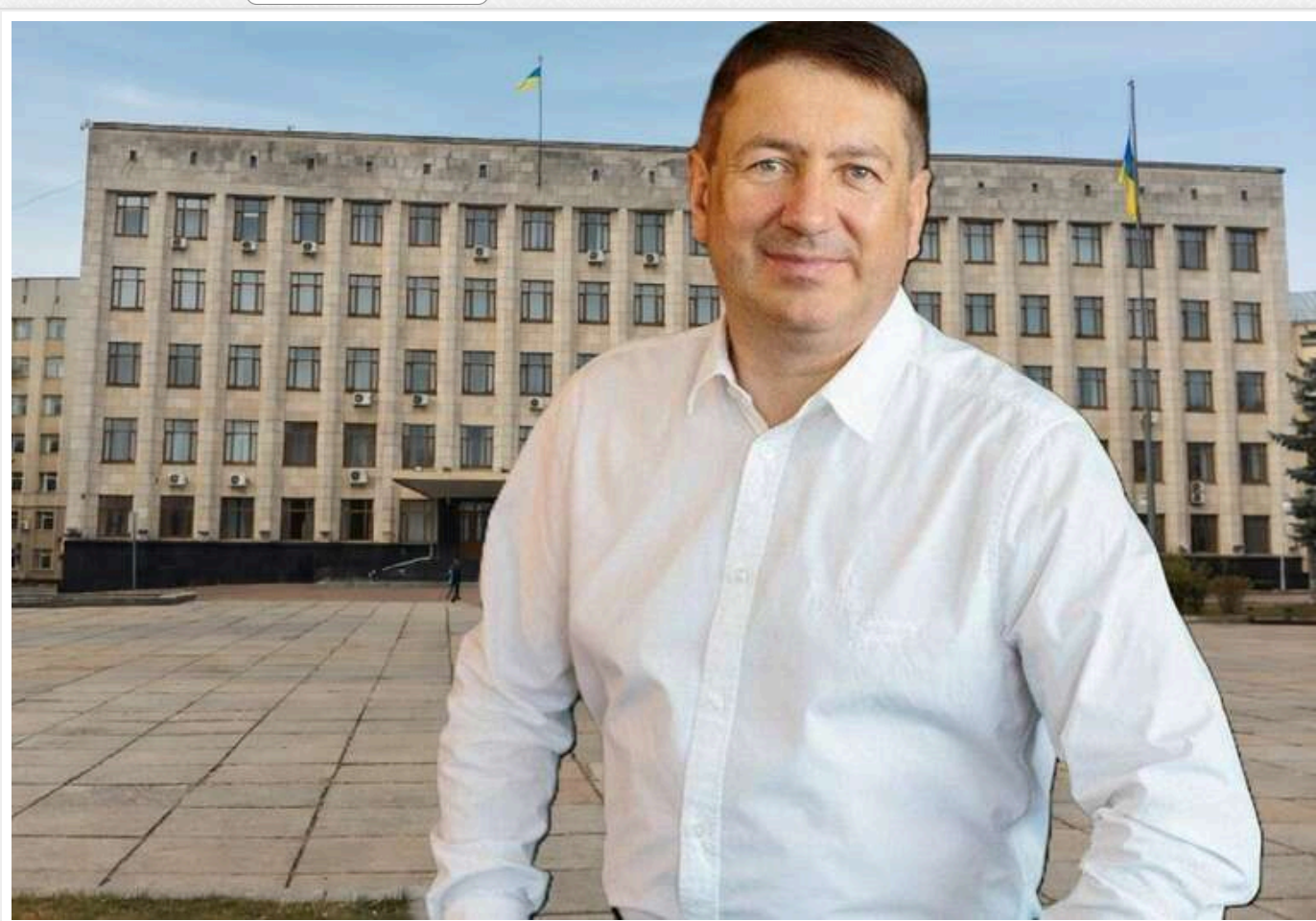
Житомирські «Міндичі» на мінімалках, або Як у найближчому до столиці регіоні ділять корупційні потоки

Житомирська область усе частіше фігурує в центрі корупційних скандалів. Останні звільнення керівника обласного управління СБУ та представника командування Повітряних сил через махінації при будівництві тому яскравий приклад. Та публічне - лише верхівка айсберга. Свіжа тема - як перевертні з тіні пиляють під час війни місцевої бюджету.