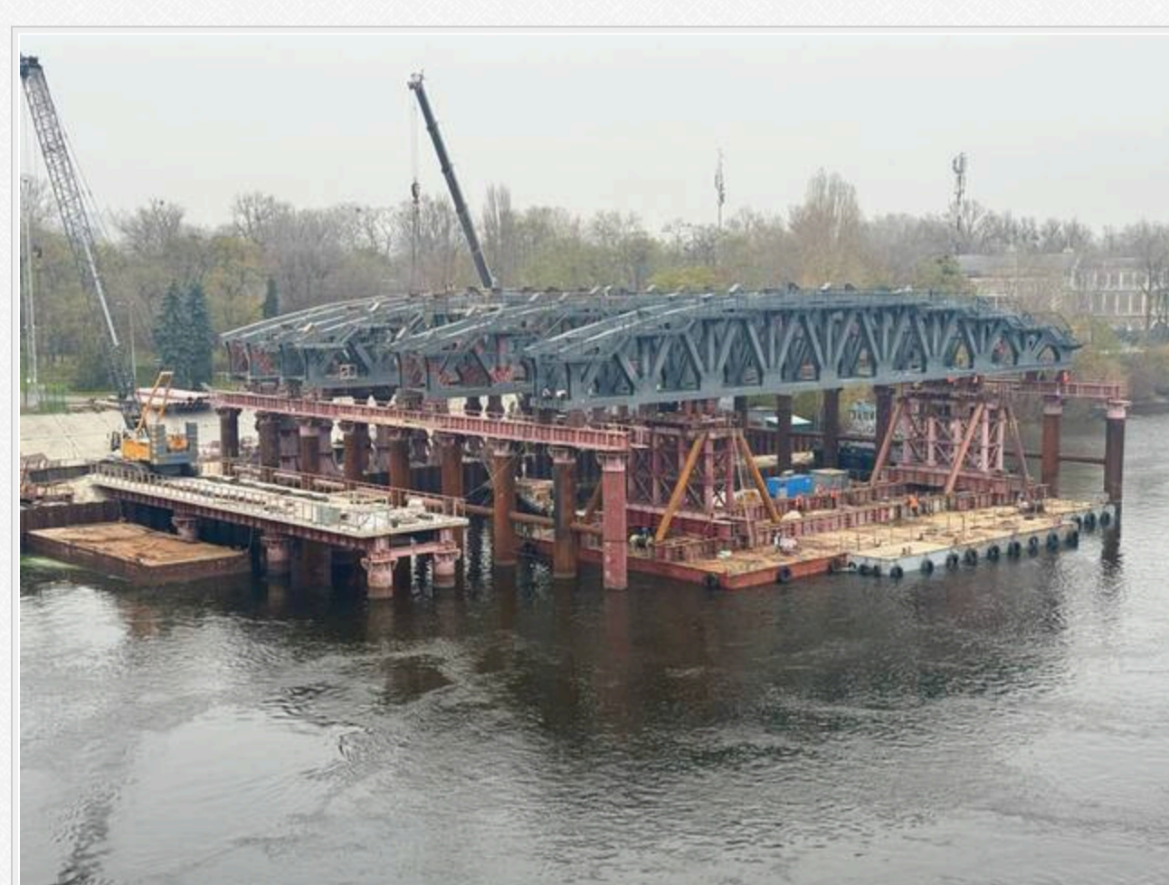
Процес встановлення підтримуючих конструкцій на мосту Метро, листопад 2025 року