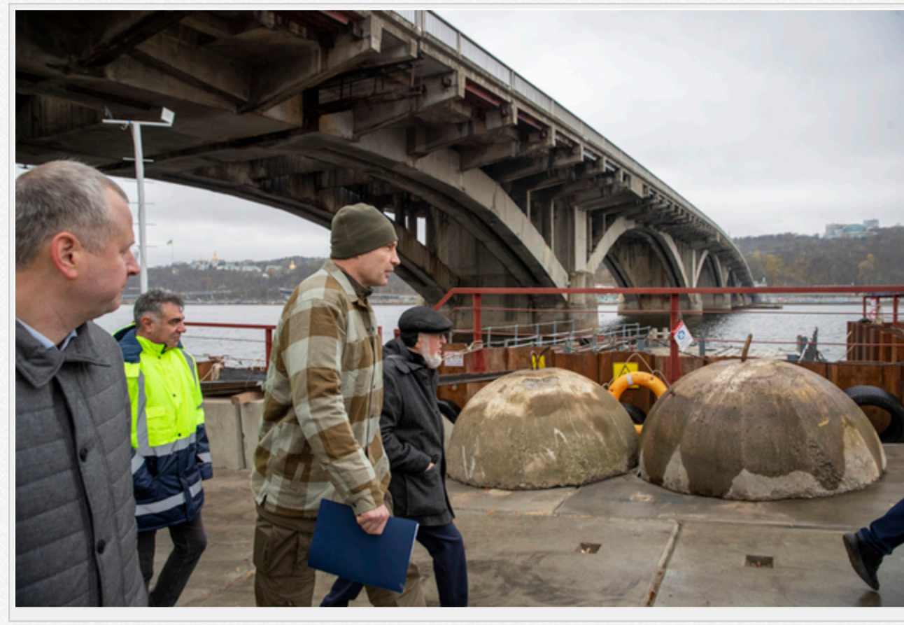
Інспектування робіт на мосту Метро, листопад 2024 року. Зліва направо: Олександр Федоренко, Віталій Кличко та Михайло Беккер

Восени 2024 року хід робіт на мосту Метро перевірів столичний мер Віталій Кличко (на колажі праворуч). Він пояснив, що встановлення підтримувальних конструкцій і прогонів споруди дозволить безпечно експлуатувати міст без його закриття до проведення повної реставрації в майбутньому.