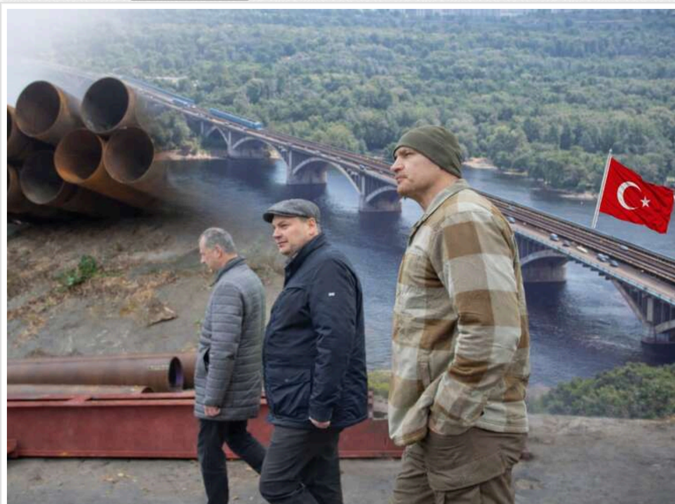
Свої проєктанти для "Онуру": як "Київавтодор" через коригування документації додав ще 10 мільйонів на міст Метро

У «Київавтодорі» вирішили за 10,7 млн зрівнень підправити проєкт протиаварійних робіт на мосту Метро. У корпорації пояснили зміни складністю та унікальністю робіт — мовляв, передбачити їх повний обсяг (відповідний дозовір вартістю 1,99 млрд зрівнень підписано у 2024 році) заздалегідь було неможливо. Коригування документації доручили ТОВ «Сінкс Плюс міжнародна інжинірингова і консалтингова компанія», яка розробляла і первинний проєкт. Заснував цю фірму колишній керівник Служби автомобільних доріг Львівщини. Нині ж компанія-проєктант належить громадянину Туреччини —, так само як і генпідрядник протиаварійних робіт на мосту Метро з бізнес-групи «Онуру». І така пов'язаність не випадкова та, видно, є відповідною схемою: встановлено низку випадків, коли цей проєктант готує документацію під «своїх», після чого компанії з групи «Онуру» без особливих труднощів ї вигарють підряди на виконання самих будівельних чи ремонтних робіт.