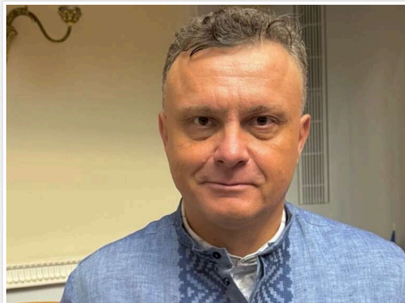
Динаміт та вирубка лісу: у Франції відкрили справу через незаконне будівництво вілли Львовчкіна

Кримінальний суд Ніцци розглядає справу щодо незаконного будівництва на віллі, що належить двом колишнім українським депутатам, зокрема – Сергію Львовчкіну.