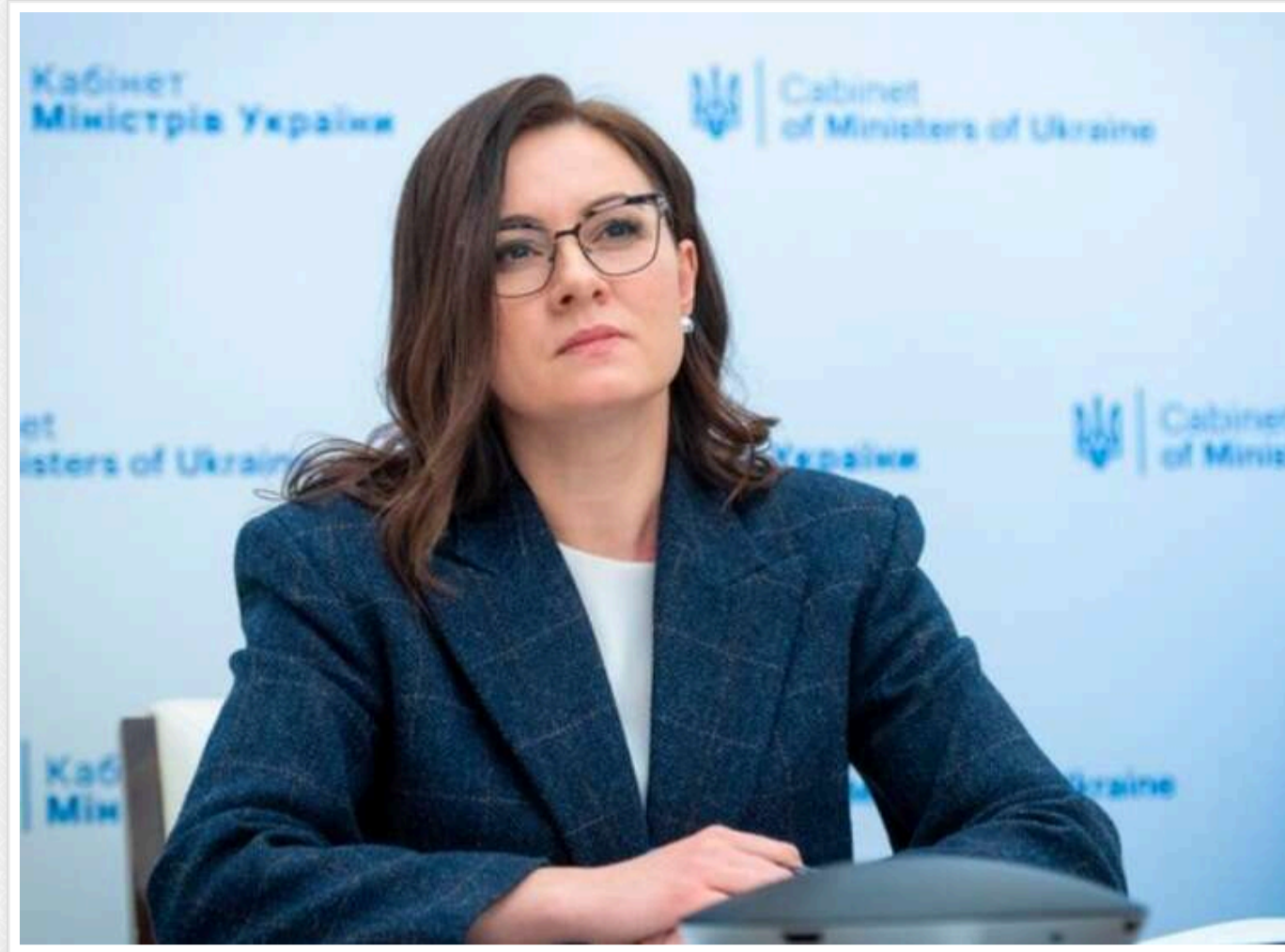
160 угод на понад 10 мільярдів євро: Свиріденко озвучила очікування України від конференції URC 2026 у Гданську

Прем'єр-міністр Юлія Свиріденко заявляє, що на Конференції з питань відновлення України (URC 2026) в Гданську Україна очікує підписати 160 угод на понад 10 млрд євро.