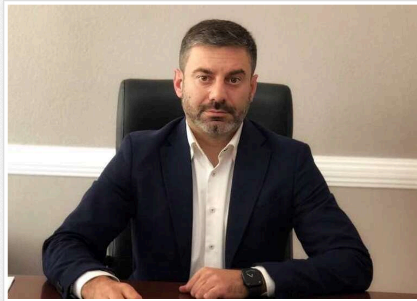
Зниження прохідного бала та право на апеляцію: Лубінець закликав Кабмін і МОН змінити правила НМТ

Уповноважений Верховної Ради з прав людини Дмитро Лубінець звернувся до Кабінету Міністрів та Міністерства освіти і науки з пропозиціями змінити правила проведення національного мультипредметного тесту.