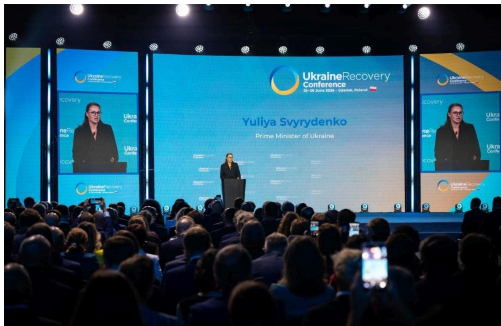
Юлія Свириденко.

Україна очікує на підписання понад 160 угод на понад 10 мільярдів євро у межах дводенної Конференції з питань відновлення України у польському місті Гданськ.