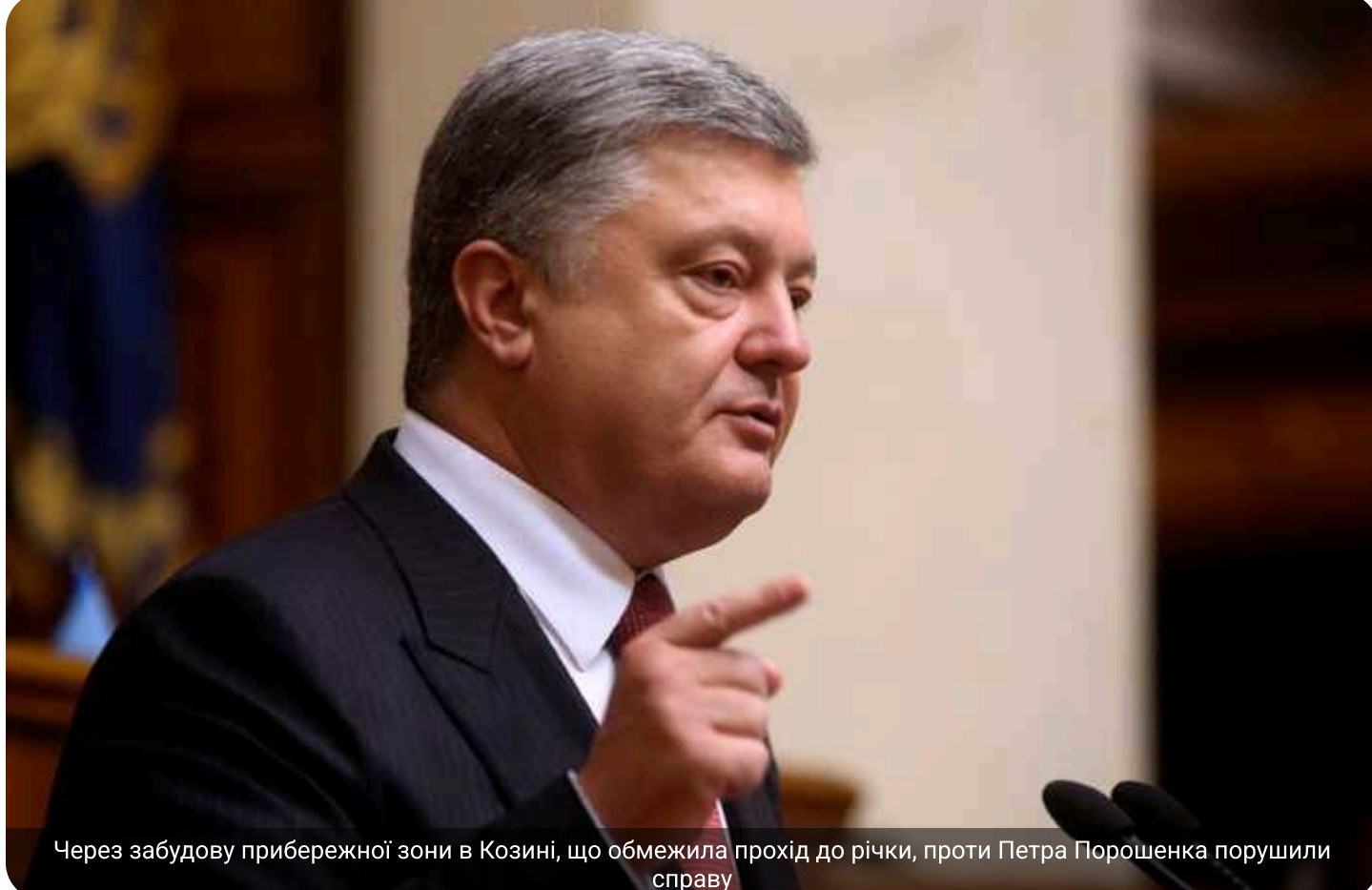
Через забудову прибережної зони в Козині, що обмежила прохід до річки, проти Петра Порошенка порушили справу

Проти Петра Порошенка відкрито кримінальну справу через незаконну забудову на березі річки в Козині.