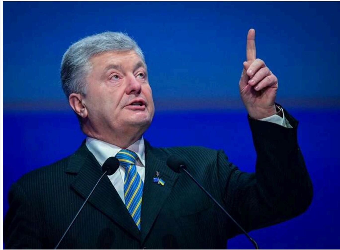
Проти Петра Порошенка відкрили справу через забудову берега річки в Козині

Проти Петра Порошенка відкрито кримінальну справу через незаконну забудову на березі річки в Козині.