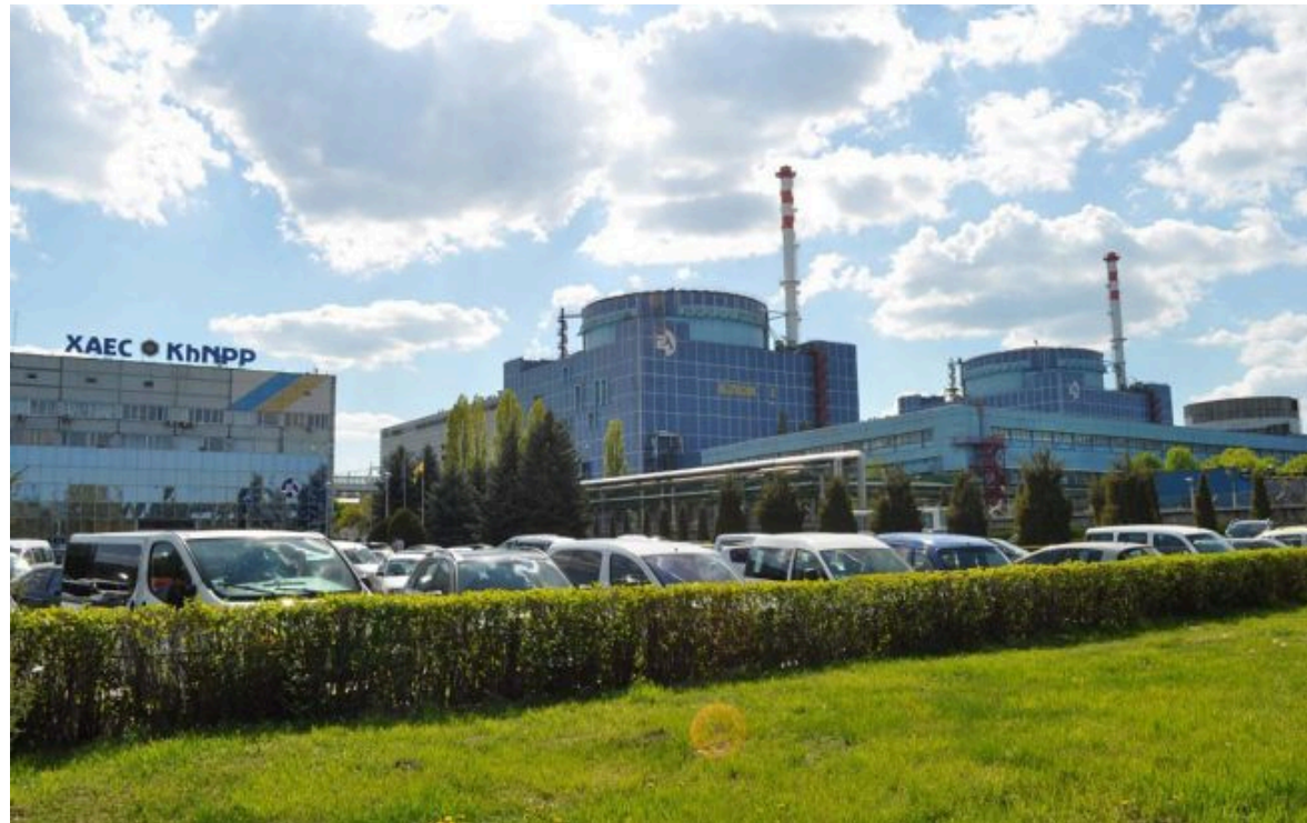
Фото: Хмельницька атомна електростанція (uatom.org)