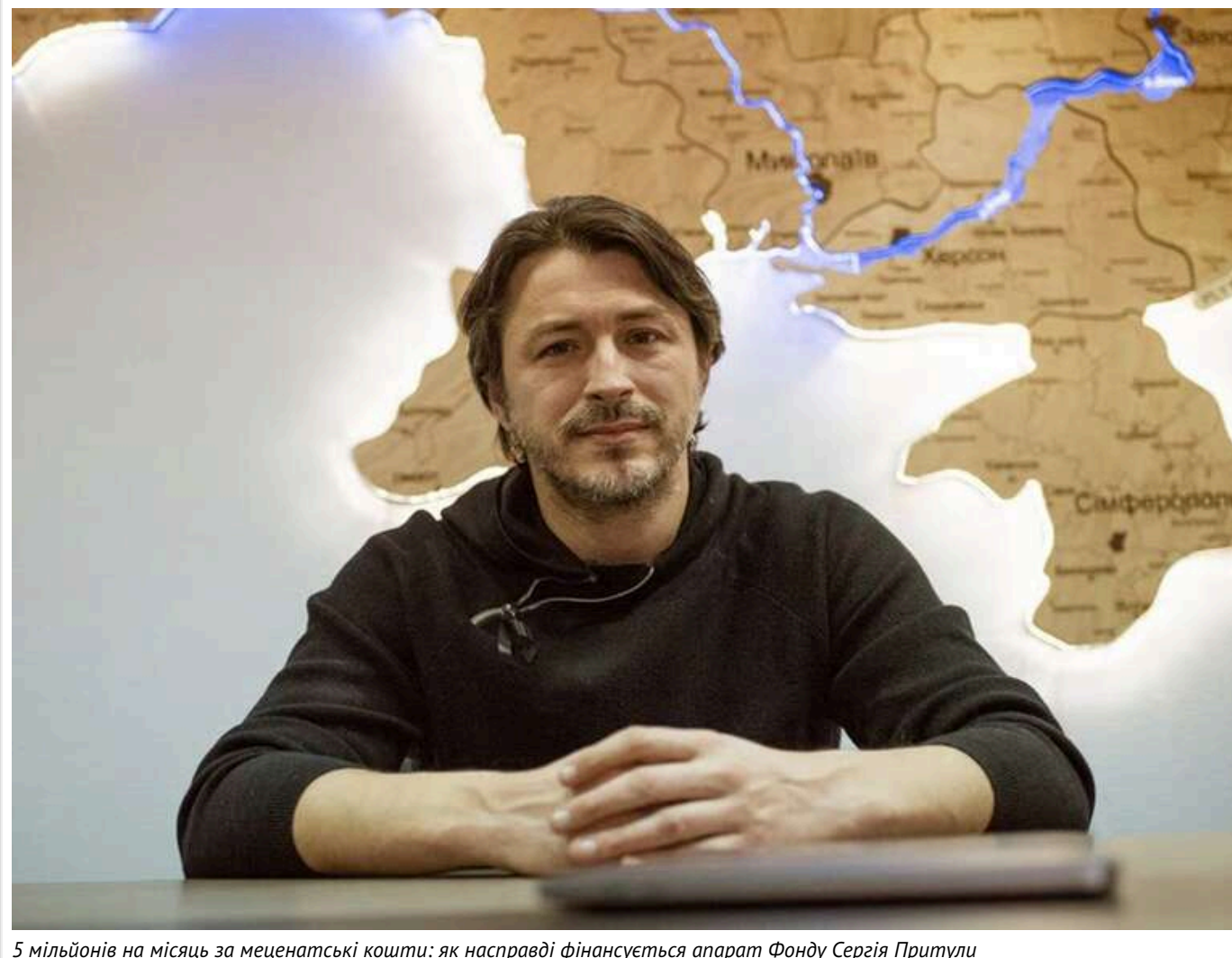
5 мільйонів на місяць за меценатські кошти: як насправді фінансується апарат Фонду Сергія Притули

Журналіст-розслідувач Юрій Ніколов опублікував роз'яснення щодо фінансової діяльності Благодійного фонду Сергія Притули після резонансного інтерв'ю Яни Зінкевич («Госпітальєри»).