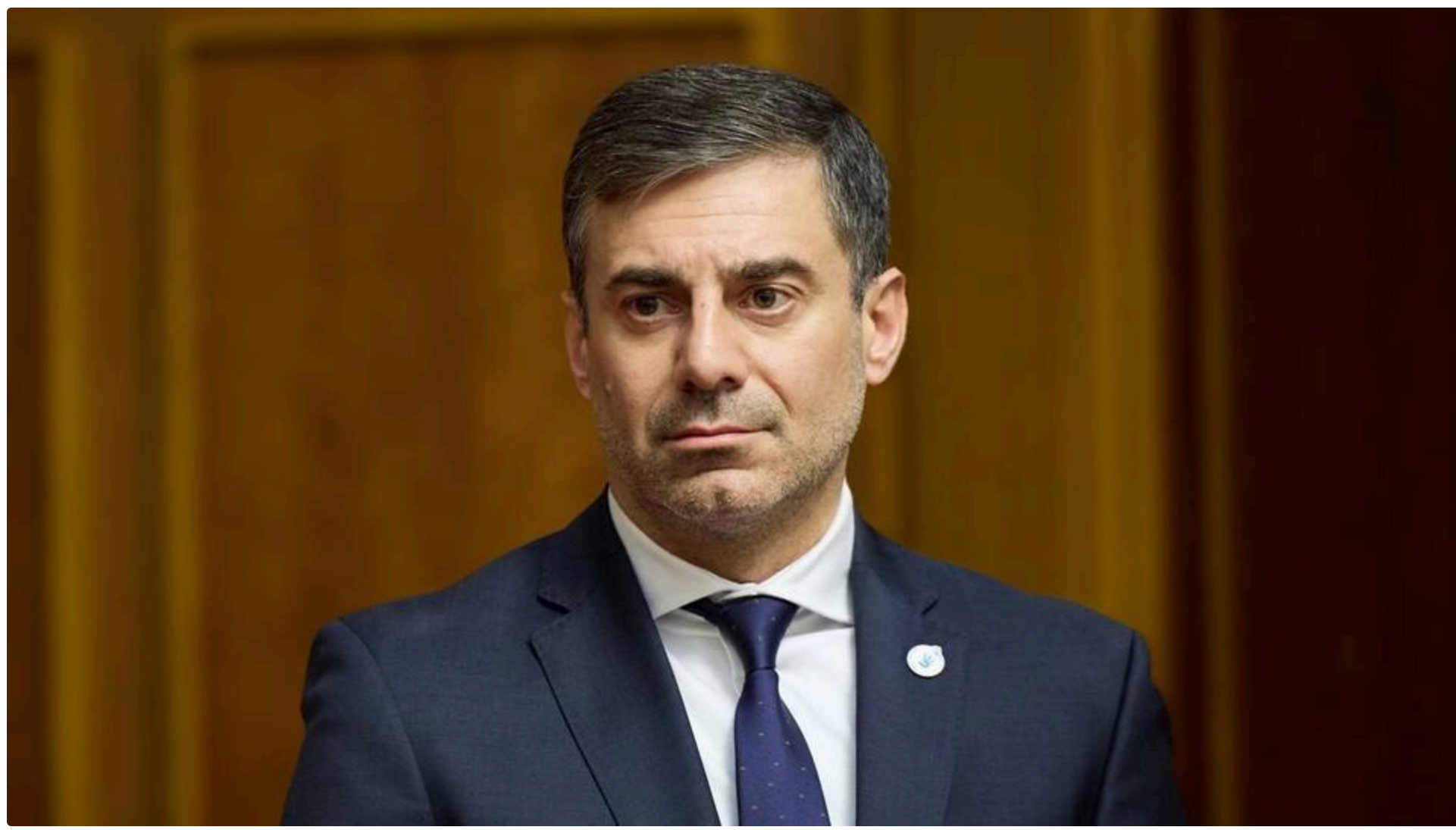
Лубінець анонсував перевірку у "Скелі"

25 червня, 01:47 🗨️ Этот материал также можно прочитать на русском