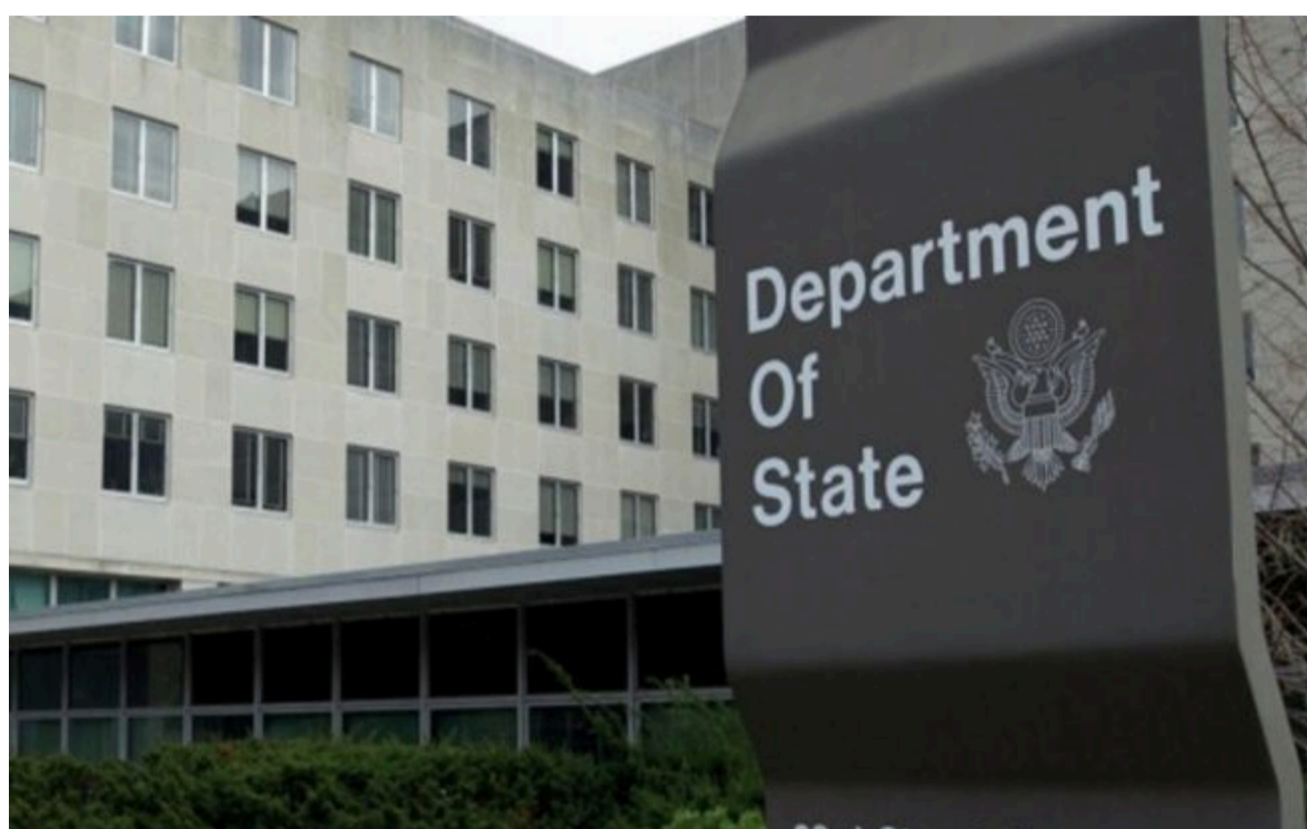
Фото: будівля Держдепу США (з відкритих джерел)