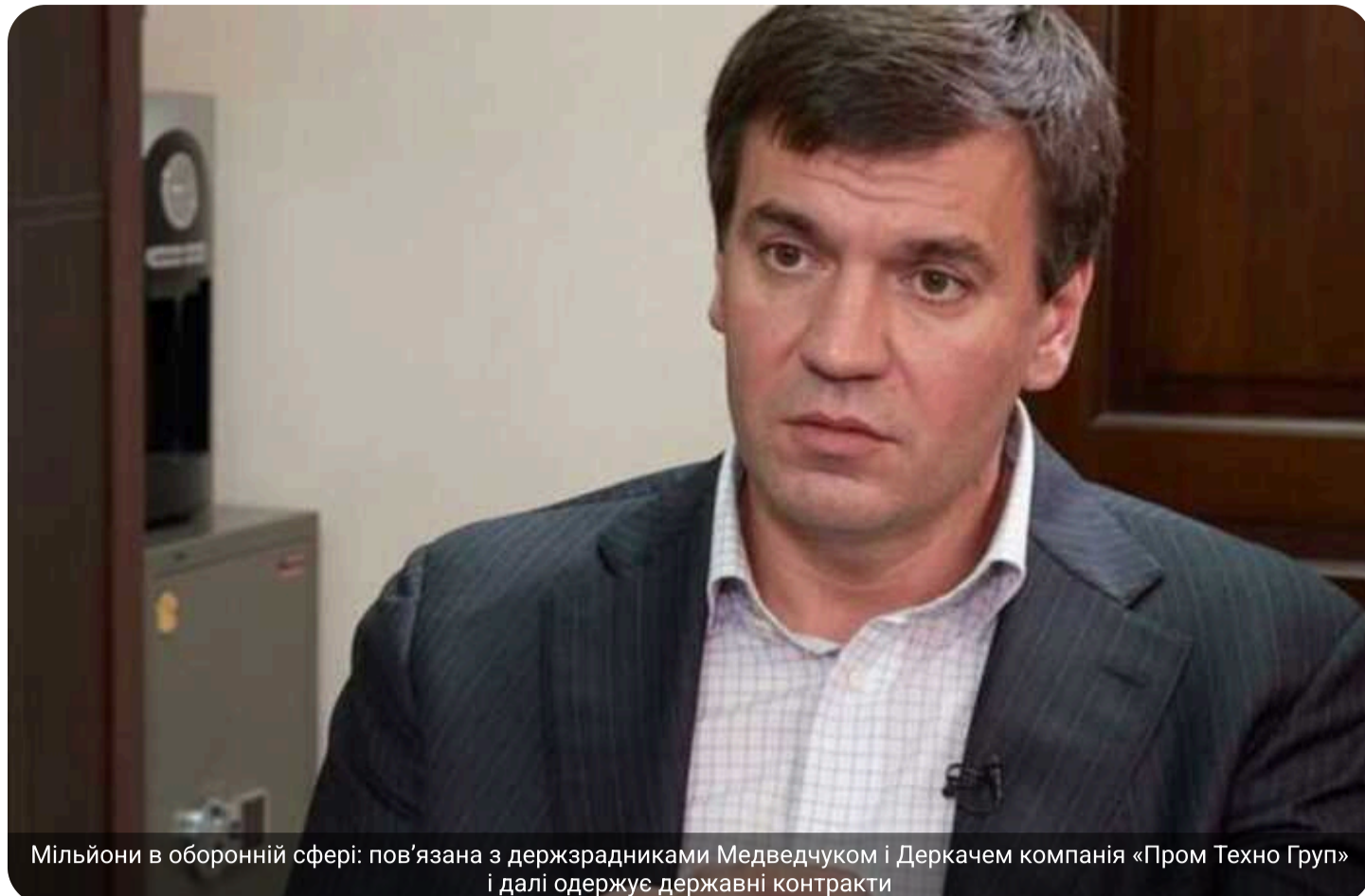
Мільйони в оборонній сфері: пов'язана з держзрадниками Медведчуком і Деркачем компанія «Пром Техно Груп» і далі одержує державні контракти

Попри корупційні скандали та згадки про зв'язки з підсанкційними особами, компанія «Пром-Техно Груп», пов'язана з Дмитром Бутом, Юрієм Кравченком та Богданом Висоцьким, зберігає позиції одного з найбільших постачальників оборонного сектору.