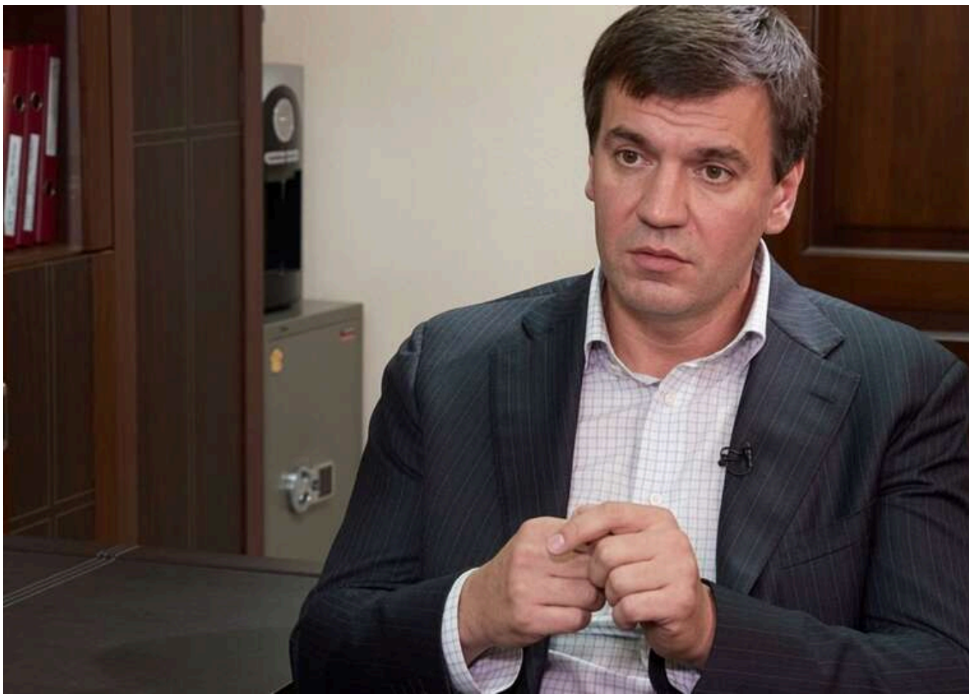
Мільйони на оборонці та зв'язки зі зрадником Медведчуком і Деркачем: як «Пром-Техно Груп» Дмитра Бута зберігає держконтракти

Читати на руськом Read in English Додати як бажане джерело в Google