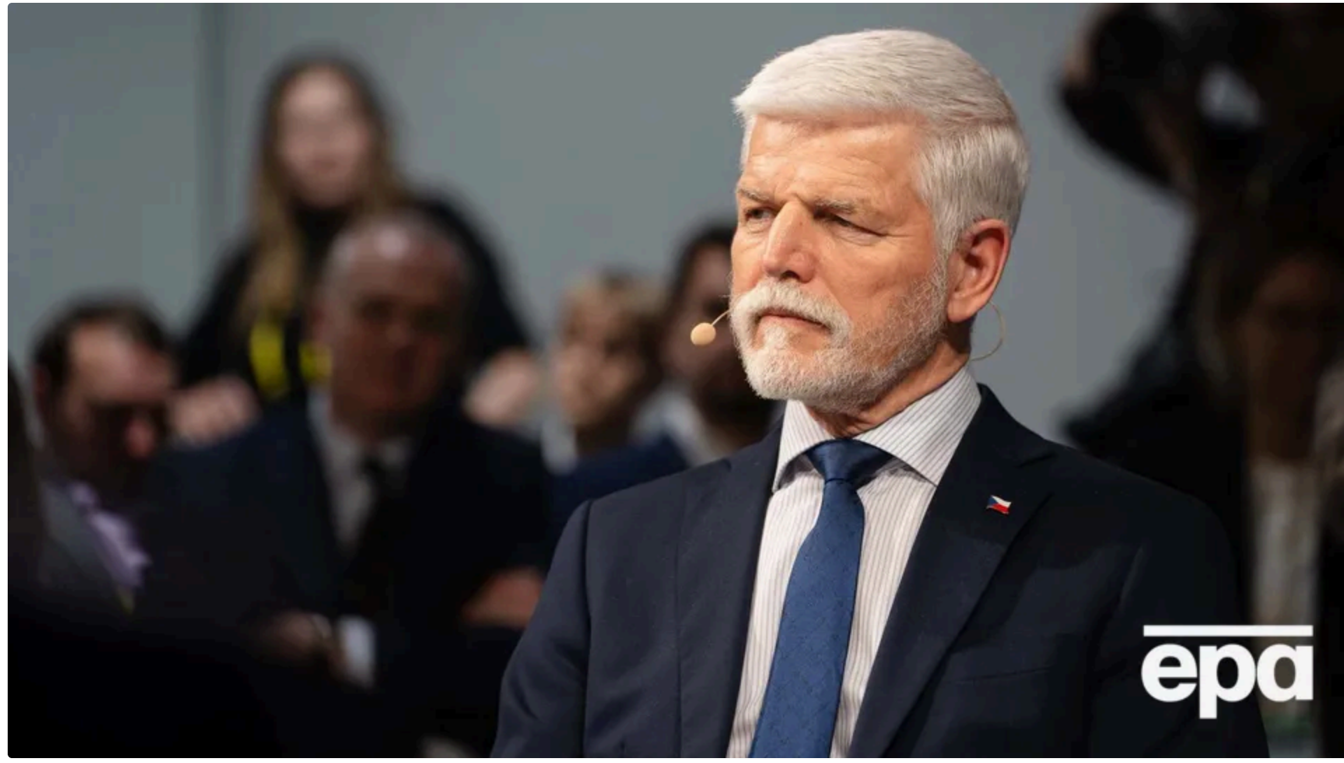
Павел повідомив про рішення суду в X

24 червня, 22.45 🗨️ Этот материал также можно прочитать на русском