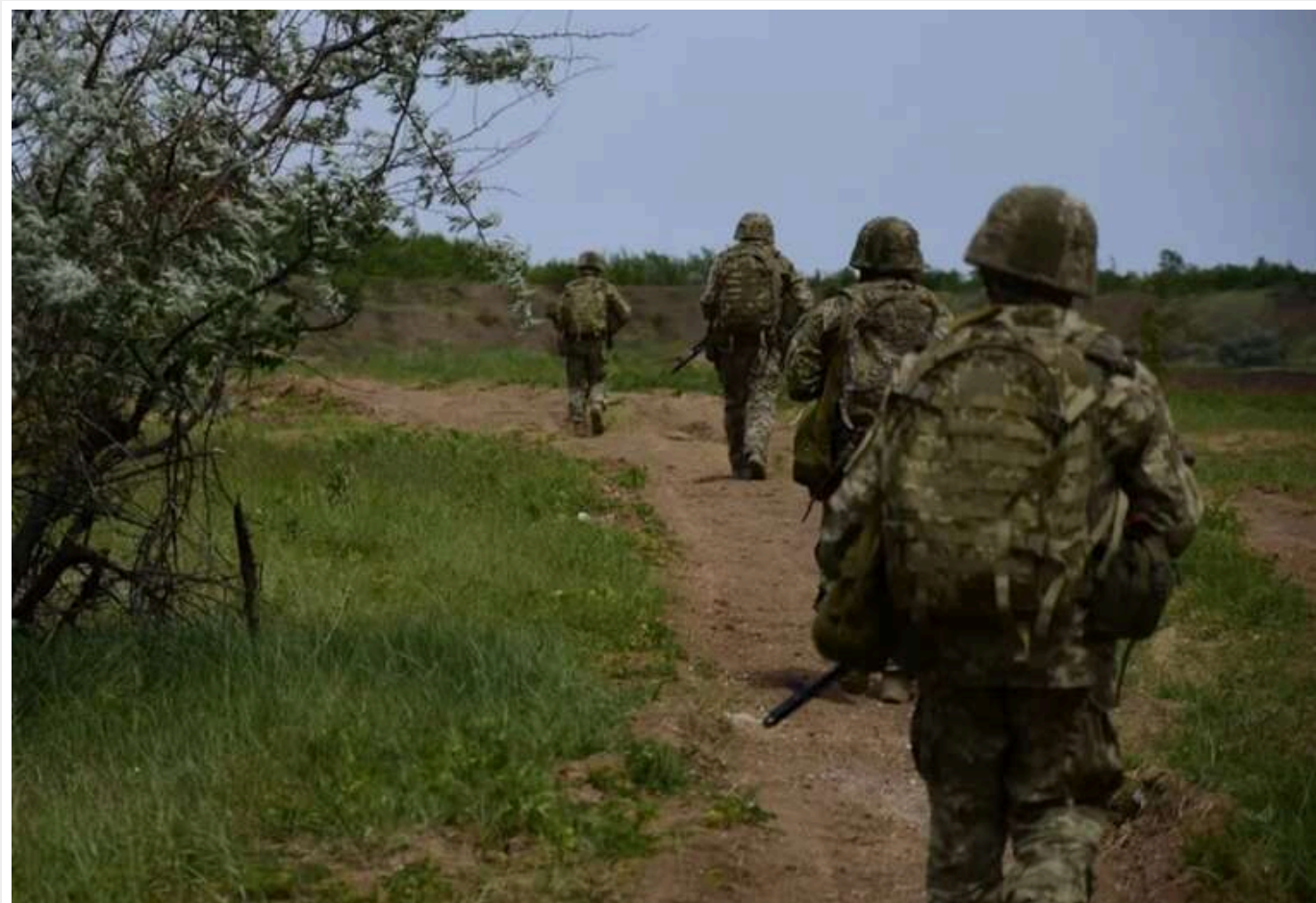
«Україна наразі виграє війну»: у Держдепі США оцінили ситуацію на полі бою

У Державному департаменті США оцінюють, що Україна зараз перебуває у моменті, коли вона виграє війну.