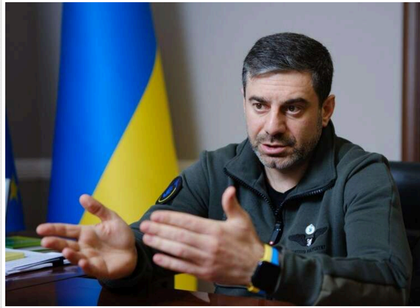
Лубінець заявив про факти мобілізації непридатних громадян до штату ТЦК

В українському медіапросторі поширюється резонансна заява Уповноваженого Верховної Ради з прав людини Дмитра Лубінця щодо правопорушень у процесі мобілізації.