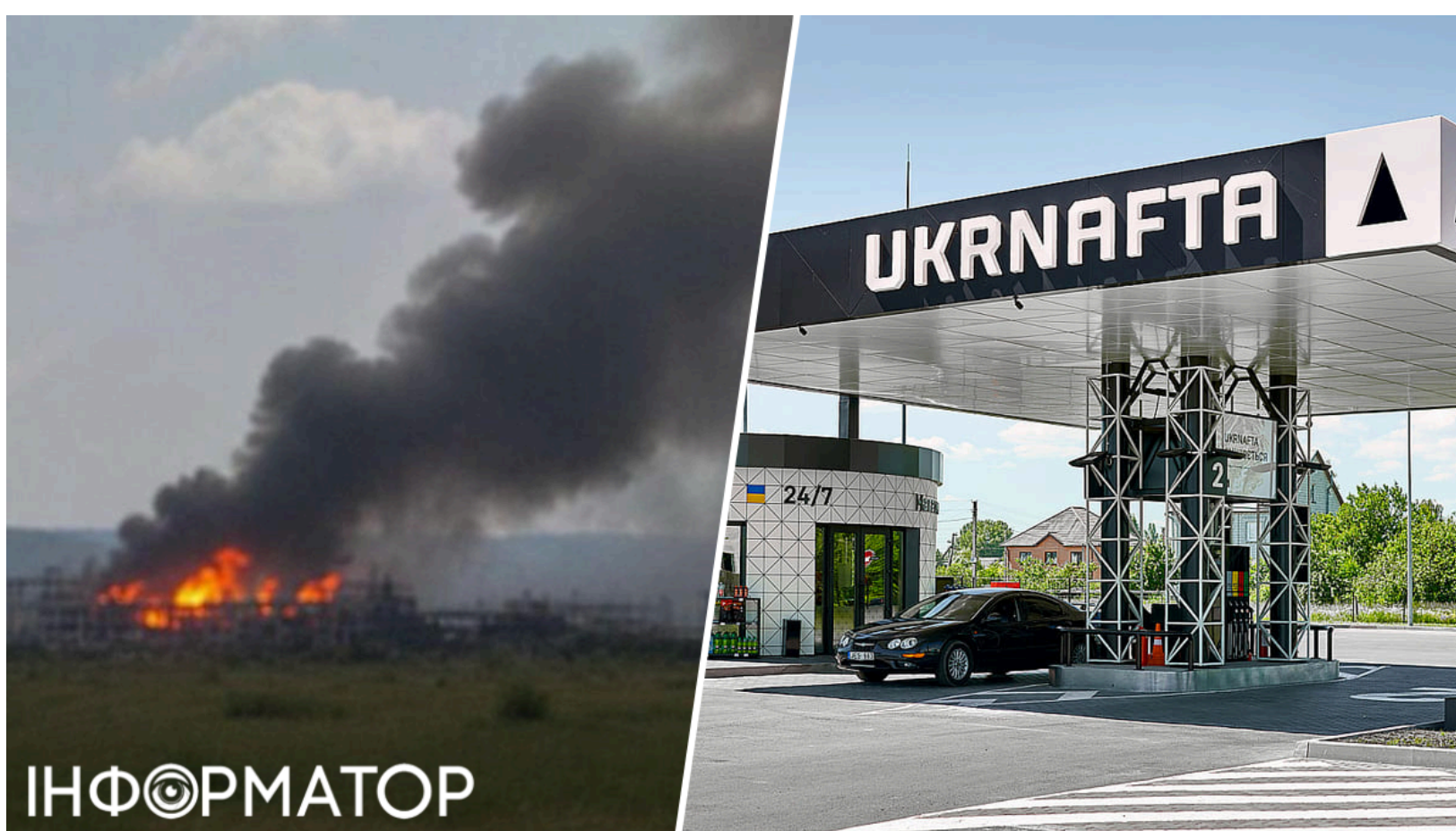
Росія вдарила по АЗК Укрнафти та Нафтогазу

Росія завдала ударів по мережі автозаправних комплексів Укрнафти та виробничих об'єктах Групи Нафтогаз одночасно в кількох регіонах України. Цього разу ворог атакував на кількох напрямках поспіль - невдовзі після серії ударів по газовій інфраструктурі на Харківщині та Полтавщині, що тривали більше доби. Внаслідок однієї з атак серйозно поранено працівницю АЗК. Жінку госпіталізували у важкому стані.