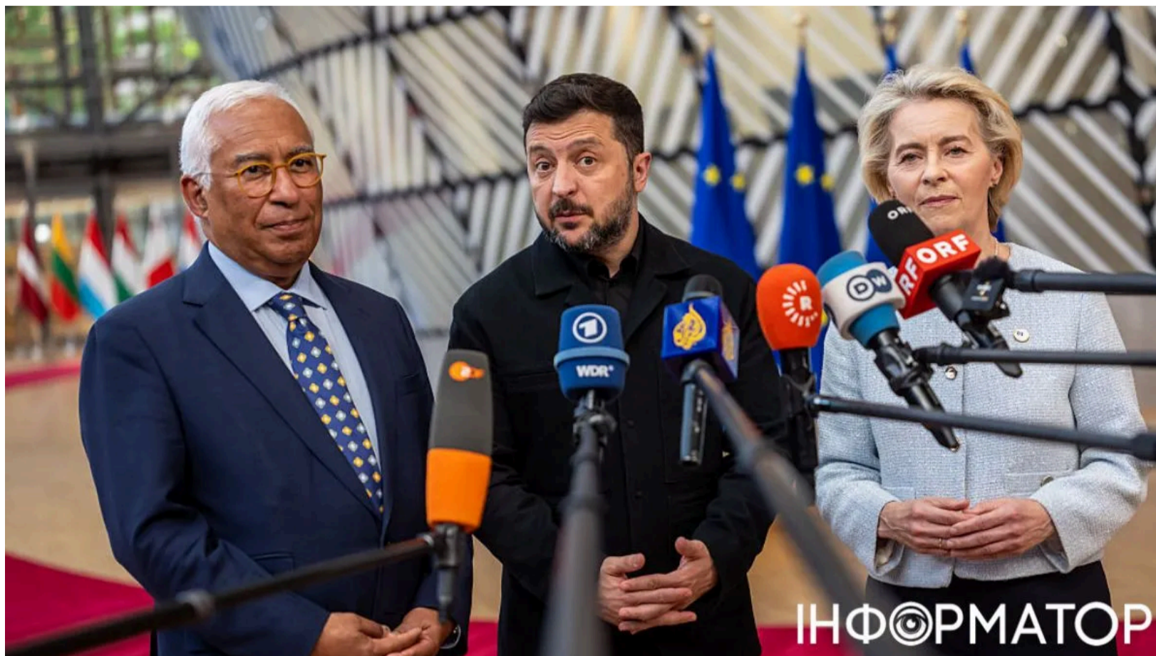
Володимир Зеленський на саміті ЄС з президентом Європейської Ради Антоніо Костою та президенткою Єврокомісії Урсулою фон дер Ляєн.

Євросоюз змінив призначення першої виплати з кредиту для України на 90 млрд євро : замість раніше анонсованих 5,9 млрд євро на виробництво дронів перша виплата становитиме 3,2 млрд євро бюджетної підтримки. Перший транш має бути оголошений під час Конференції з відновлення України у польському місті Гданськ. Президент Зеленський пропустить конференцію через дипломатичну суперечку з президентом Польщі Каролом Навроцьким, а українську делегацію очолить прем'єр-міністерка Юлія Свириденко.