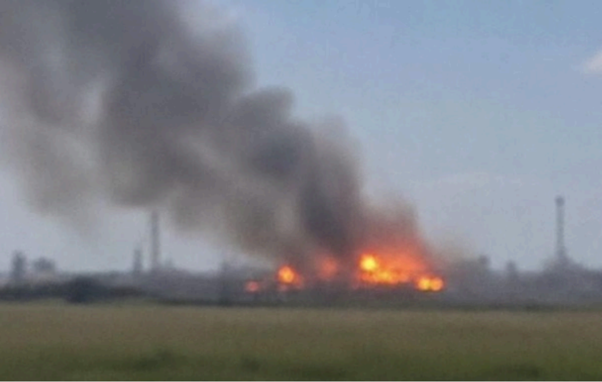
Пожежа на об'єкті Нафтогазу

Завдяки оперативним діям рятувальників ДСНС та фахівців Нафтогазу на одному з об'єктів вдалося швидко ліквідувати пожежу.