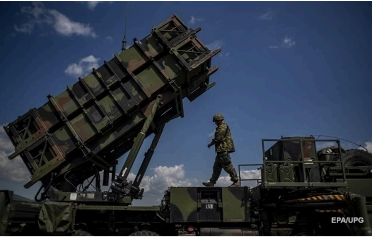
Швейцарія шукає альтернативу системам Patriot, які є більш пріоритетними в поставках США для України

З огляду на погіршення геополітичної ситуації, Федеральна рада заявила про необхідність термінового посилення можливостей протиповітряної оборони країни.