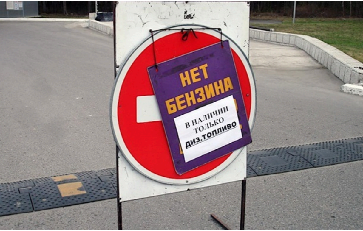
Росія шукає пальне в інших країнах

Москва веде переговори з Казахстаном про імпорт близько 50 тисяч метричних тонн бензину АІ-92 і вже домовилася про масштабний імпорт з Індії.