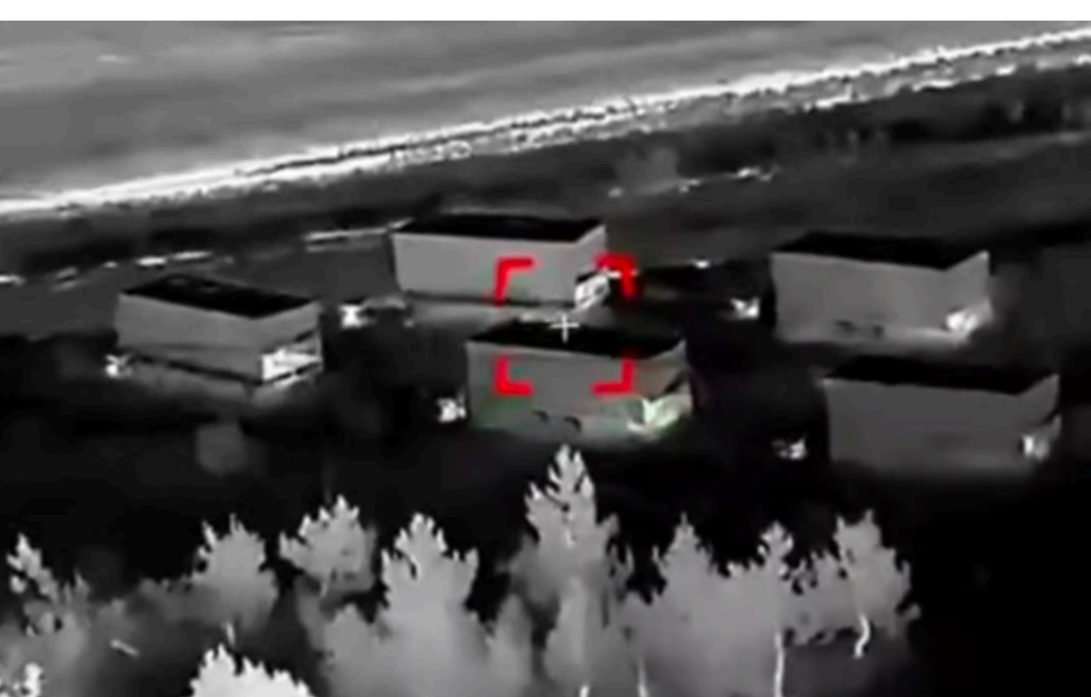
У Керчі знищили систему протидії Starlink Волна Купол Гарант

За оцінками фахівців, один такий комплекс здатний покривати територію площею близько 20 кв. кілометрів.