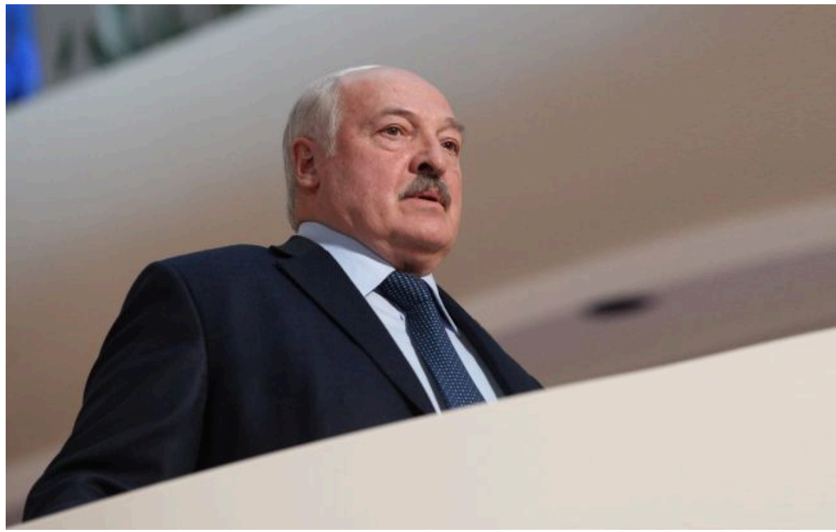
Фото: білоруський диктатор Олександр Лукашенко