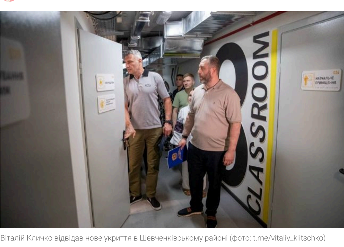
Віталій Кличко віддає нове укриття в Шевченківському районі

Не витрачай час на шум! Читай тільки суть з РБК-Україна у Google