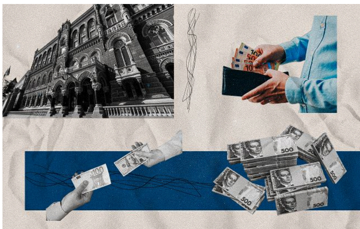
Фото: офіційний курс долара та євро на 24 червня