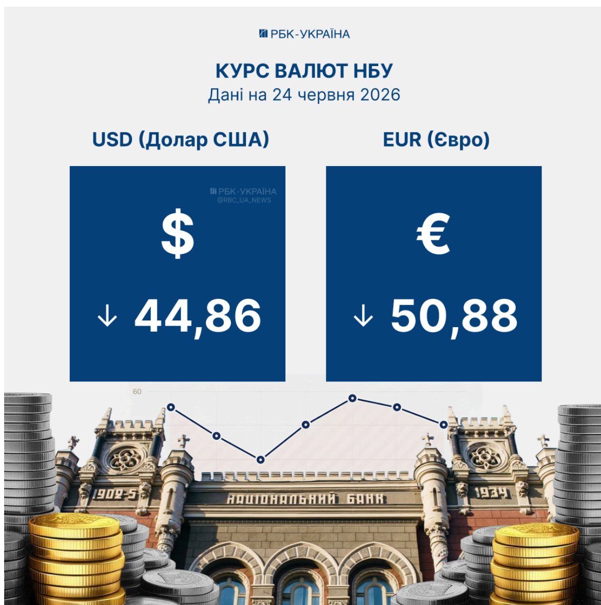
Курс валют НБУ на 24 червня (Інфографіка РБК-Україна)

Таким чином американська валюта продовжує поступове зниження, тоді як євро після кількох днів падіння опустився нижче позначки у 51 гривню.