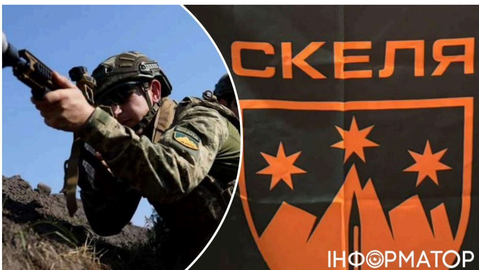
ДБР розслідує загибель новобранців у Скелі

Державне бюро розслідувань відкрило кримінальне провадження щодо можливих порушень прав військовослужбовців штурмового полку "Скеля" після резонансної публікації у ЗМІ. Слідчі внесли дані до Єдиного реєстру досудових розслідувань за статтею про перевищення військовою службовою особою влади в умовах воєнного стану, що спричинило тяжкі наслідки. Досудове розслідування триває, а процесуальне керівництво здійснює Дніпровська спеціалізована прокуратура у сфері оборони Східного регіону.