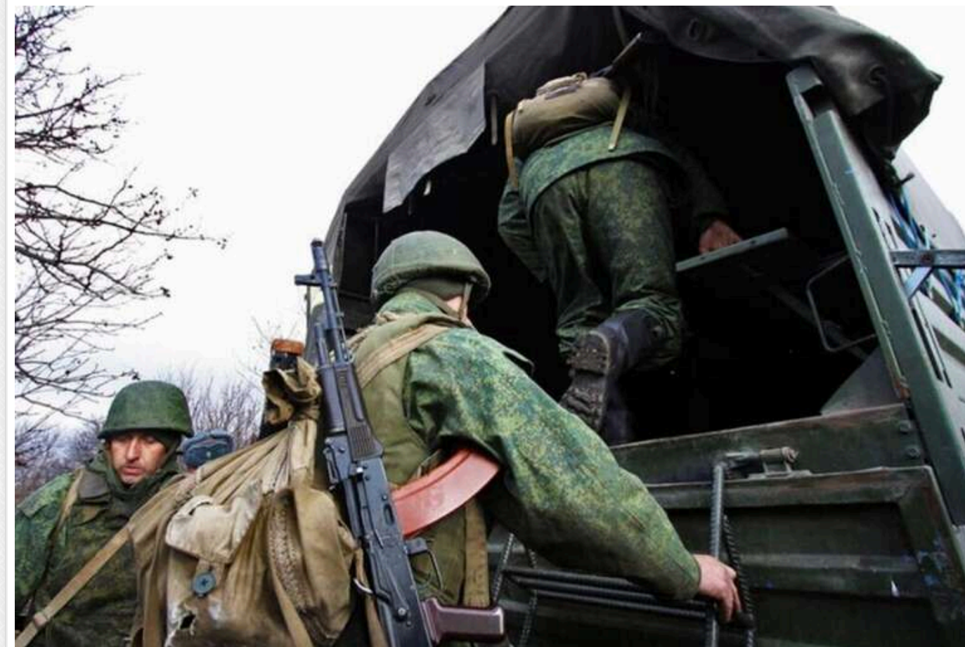
У Кремлі обговорюють нову хвилю мобілізації через стрімке падіння темпів набору контрактників, — ЗМІ

Читати на руском Додати як бажане джерело в Google