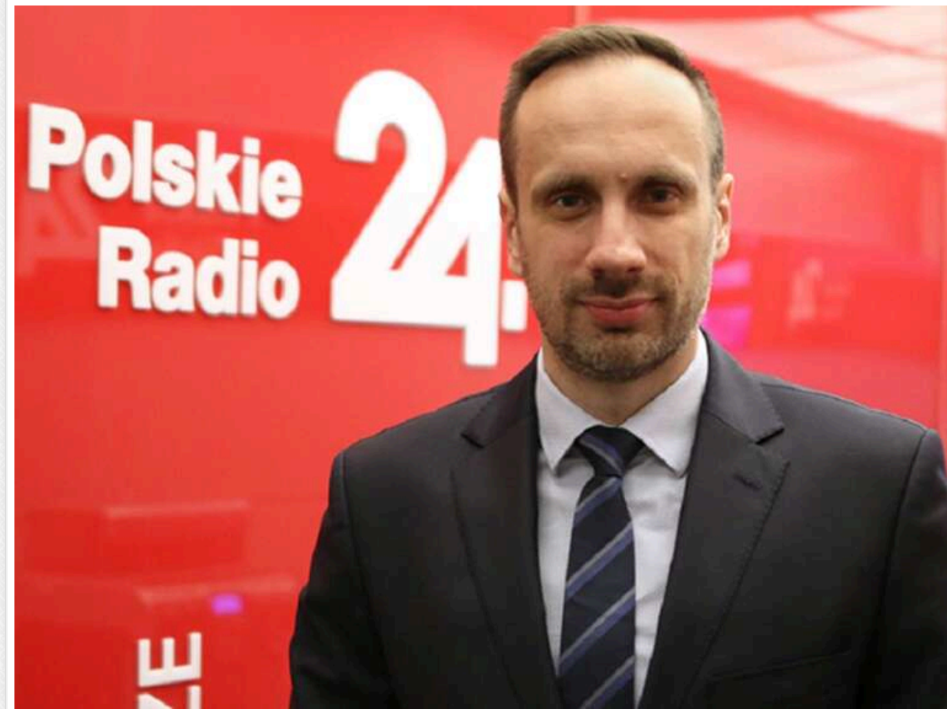
«Усі мають повернутися»: ультраправий польський депутат закликав вислати українців з країни

Депутат польського Сейму від ультраправих сил зажадав депортувати всіх українців з країни.