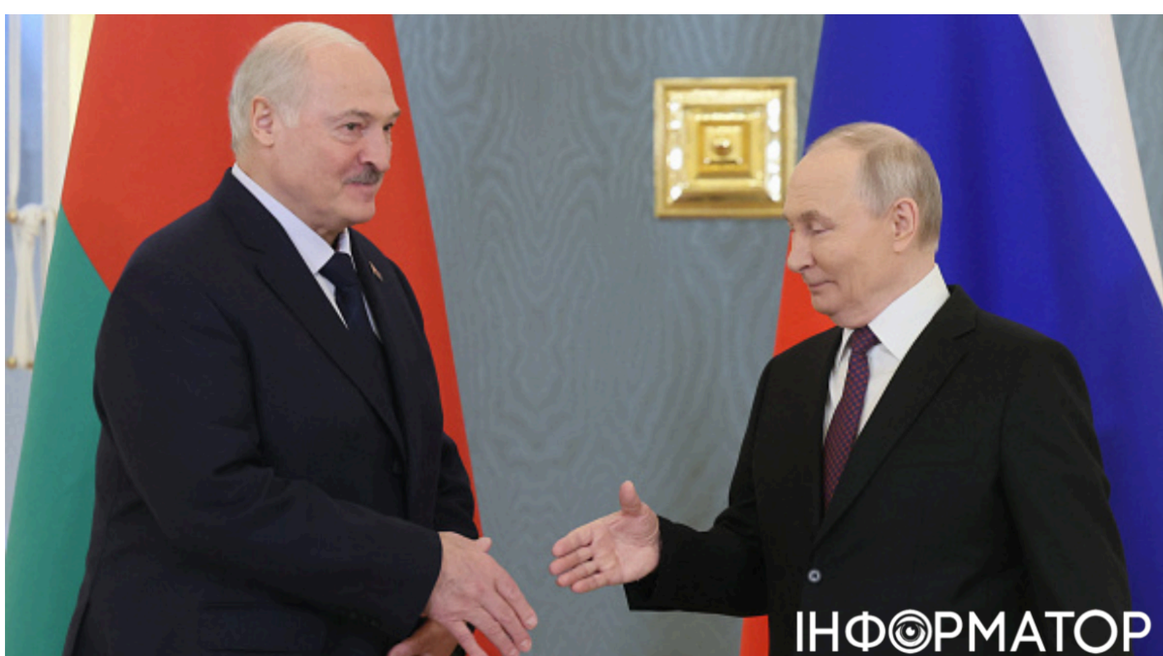
Російський диктатор тисне на білоруського президента.

Москва посилила тиск на Мінськ і вимагає від президента Білорусі Олександра Лукашенка безпосередньої участі у війні проти України - розкриваючи при цьому конкретний перелік завдань для білоруської сторони. Ймовірність нового вторгнення з Білорусі обговорюється все активніше. Кремль використовує фінансовий шантаж як головний важіль впливу на режим Лукашенка, який критично залежить від російських субсидій. Відмова від вимог Москви загрожує економічним крахом його режиму.