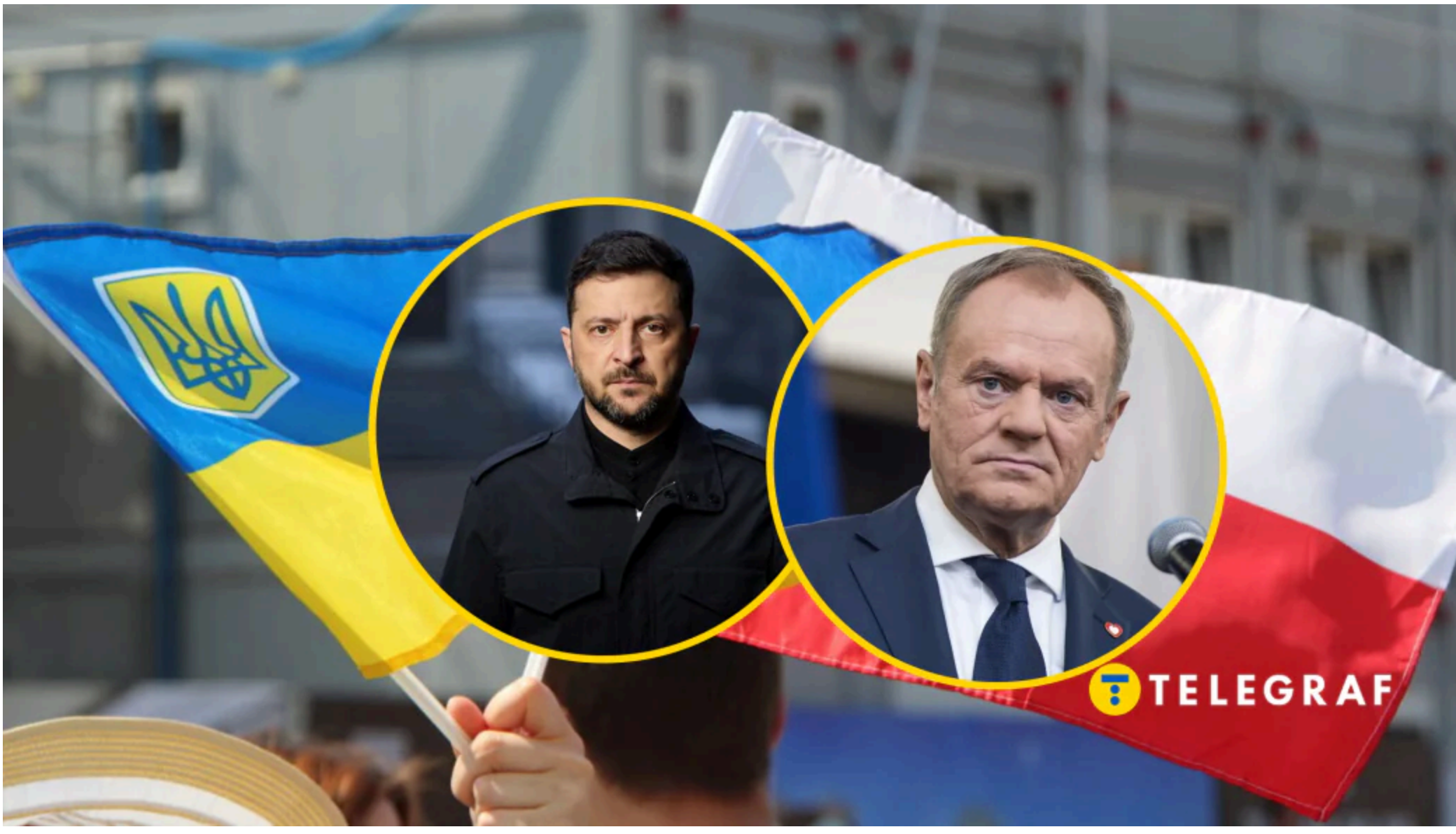
Туск вважає рішення Зеленського кроком до зменшення напруги.

Замість президента делегацію України очолить прем'єр-міністерка