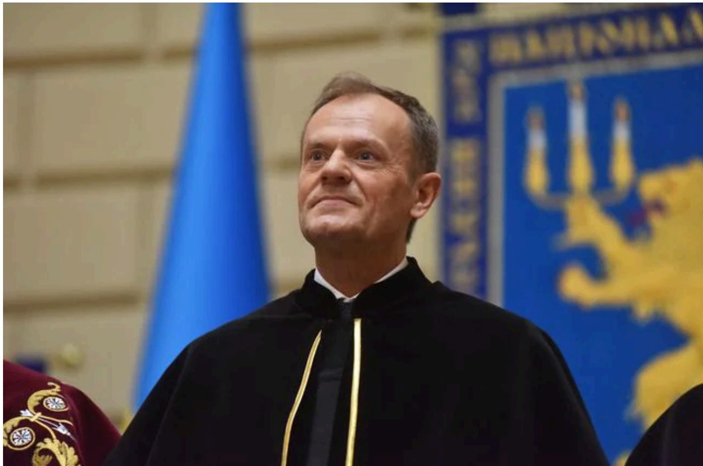
Дональд Туск.

"Якщо йдеться про мене, то я не розчарований. На мою думку, це (відсутність Зеленського, — ред.) означає, можливо, навіть більш вправне проведення конференції, без непотрібної напруги й сприймаю це як жест деескалації напруги", — сказав Туск.