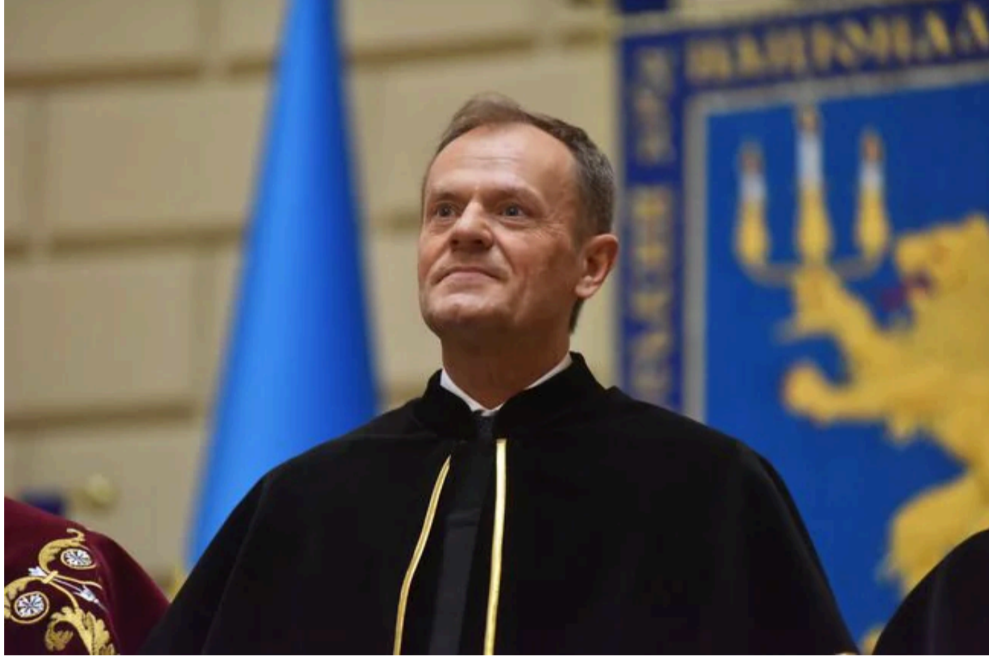
Дональд Туск.

"Якщо йдеться про мене, то я не розчарований. На мою думку, це (відсутність Зеленського, — ред.) означає, можливо, навіть більш вправне проведення конференції, без непотрібної напруги її сприймаю це як жест деескалації напруги", — сказав Туск.